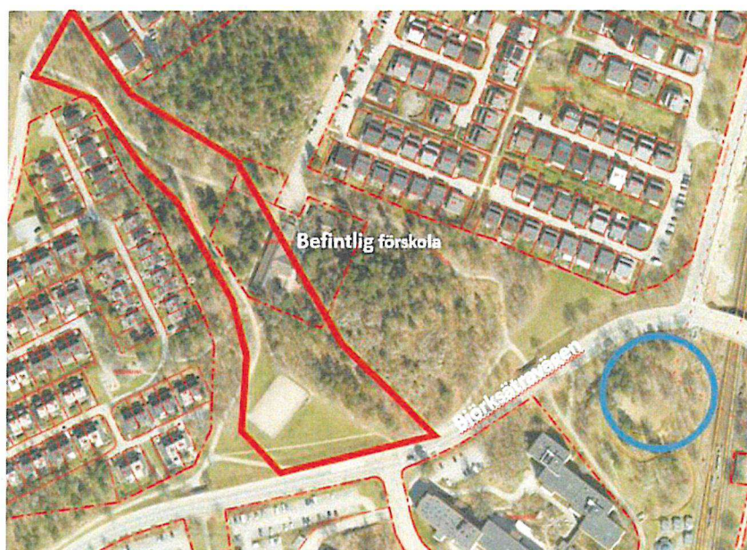
Markanvisningsområden inom projekt Kråksätra. Röd markering visar föreslagen markanvisning för radhus till Erik Wallin och blå markering föreslagen markanvisning för förskola till SISAB.

SISAB har inkommit med en markanvisningsansökan för en fristående förskola om 6-8 avdelningar. Förskolan bidrar med totalt cirka 20 arbetsplatser (varav cirka 10 redan finns inom befintlig förskola som ersätts). Förskolan föreslås upplåtas med tomträtt.