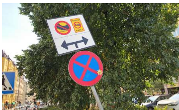
Dubbdäcksförbud och miljözon