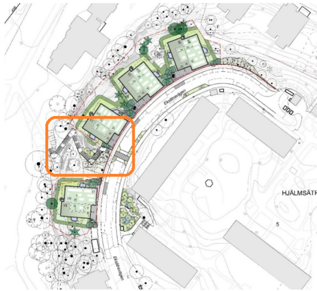
Illustrationsplan över föreslagen bebyggelse, gårdsutformning samt ny utformning av Eksättravägen. Illustration: Bergkrantz arkitektur.

Christoffer Carlander Tf. Avdelningschef Skärholmens stadsdelsförvaltning