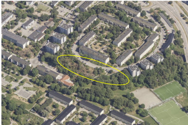
Flygvy med planområdet grovt markerat.