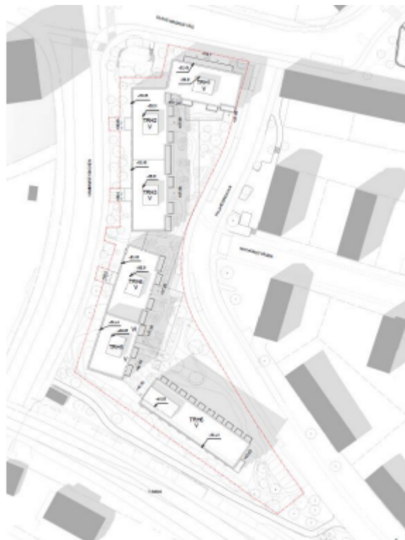
Illustrationsplan över förslaget. (AIX Arkitekter, 2021).

Planförslaget innehåller cirka 140 bostadsrätter i flerbostadshus. För att understryka Olaus Magnus väg som nytt stråk mot Hammarbyhöjdens centrum möjliggörs lokaler för centrumändamål i husens bottenvåningar. Bostadsentréer för bebyggelsen längs Hammarbybacken och Olaus Magnus väg ska finnas både mot gata och mot gård. Förslaget utgörs av två halvöppna kvarter, Palandergatan dras om för att åstadkomma tydligare förgårdsmark mot befintlig bebyggelse mot öster samt för att ge plats för tillkommande bebyggelse. Byggnadsvolymerna är anpassade till omgivande byggnaders höjd på nio våningar mot väst i punkthus och tre till fyra våningar mot norr och öst. Den huvudsakliga bostadsgården är delvis underbyggd med garage som byggs med planterbart bjälklag. Dagvatten föreslås hanteras genom regnbäddar, makadamdike, växtbäddar, skelettjordar samt skåldike.