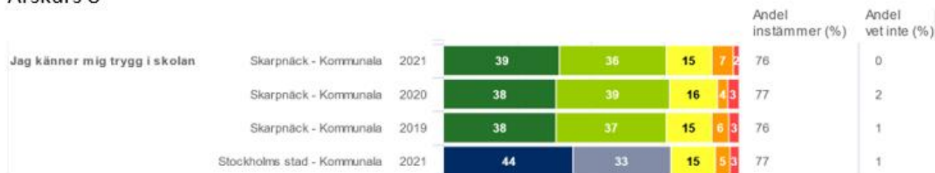
Bild 2. Upplevd trygghet i årskurs 2, 3 och 8 i de kommunala skolorna i Skarpnäck.