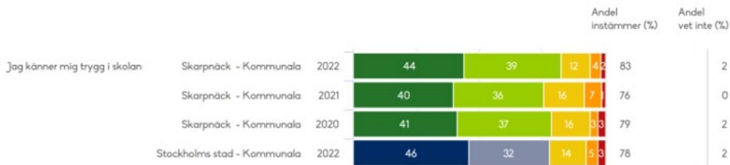
Bild 2. Upplevd trygghet i årskurs 2, 3 och 8 i de kommunala skolorna i Skarpnäck.