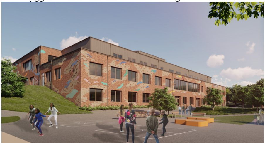
Nybyggnad sett från Skolgården

Den kvarvarande paviljongen från Expandia monteras ner när huvudbyggnaden är klar och området blir skolgård.