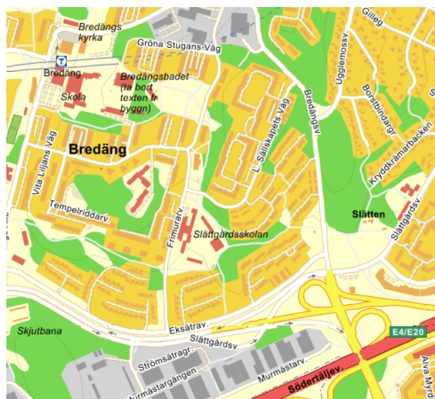
Slättgårdsskolans placering på karta.