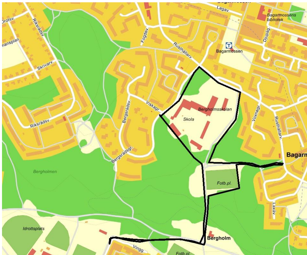
Figur 1-1. Översiktsbild hämtad från Eniro (2018), aktuellt område markerad i svart.

Geosigma AB har på uppdrag av Exploateringskontoret genomfört en översiktlig geoteknisk undersökning vid Bergholmsbacken, Bagarmossen. Området består av tidigare Bergholmsskolan samt en grusplan, se figur 1-1. Planerade bostadsexploatering sträcker sig över tidigare skolområde i norr samt befintlig fotbollsplan i utredningsområdet centrala del. Den södra delen av utredningsområdet består idag av gång- och cykelvägar.