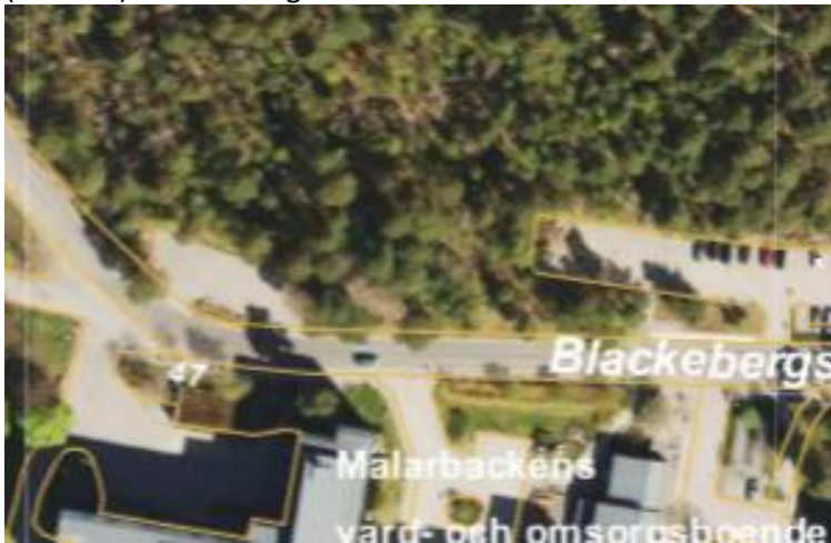
Bild 4.1 Befintlig situationsplan

Aktuellt område begränsas av Blackebergsbacken och tillhörande hårdgjorda parkeringsytor. Berg i dagen i form av bergslänt avgränsar området norrut. I övrigt utgörs området av naturmark. Marknivåer för området varierar från ca +20 till +28 (RH2000). Marken stiger åt norr och nordost.