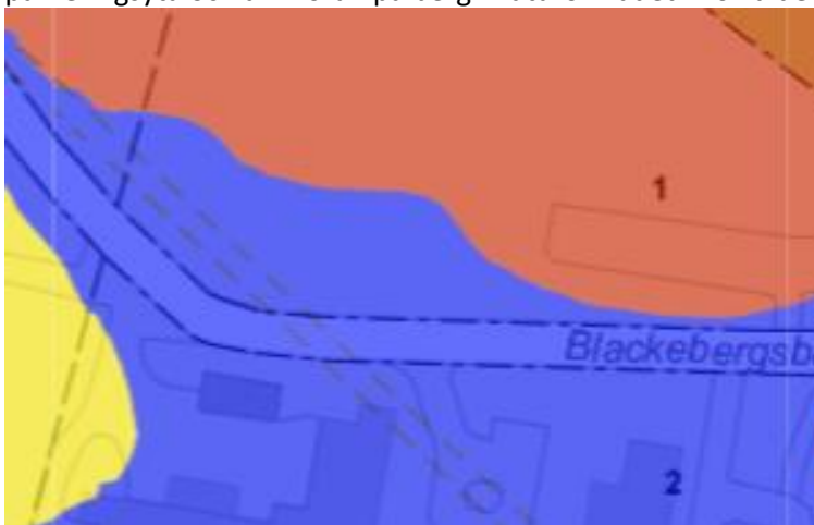
Figur 4.2 Utdrag ur Byggnadsgeologiska kartan. Rött=berg. Blått=Morän.

Generella geotekniska förhållanden, se figur 4.2. Området karakteriseras av berg eller berg med tunna ytlager jord av morän och/eller fyllning på berg i läget för befintlig parkeringsyta och av morän på berg i naturområdet i norra delen.