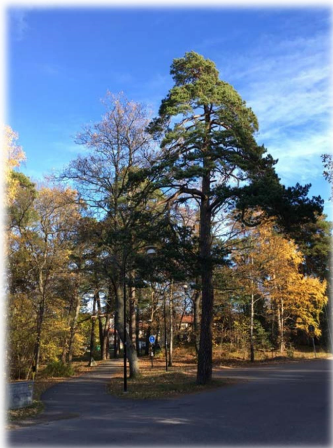
Träd nr 23 & 24

Svartsjö Trädkonsult Nöttesta 30 151 96 Enhörna 0704-90 52 81 cathrine.bernard@telia.com