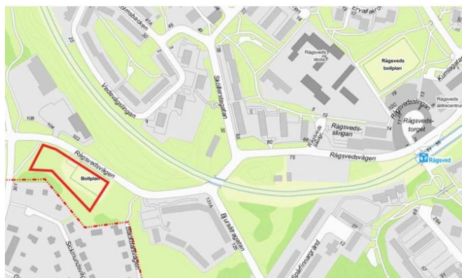
Figur 3 Orienteringskarta med planområde inom rödmarkerat område

I närheten finns befintlig bebyggelse bestående av ett befintligt villaområde (närboende), bensinstation söder om planområdet samt en bilverkstad och bensinstation norr om planområdet.