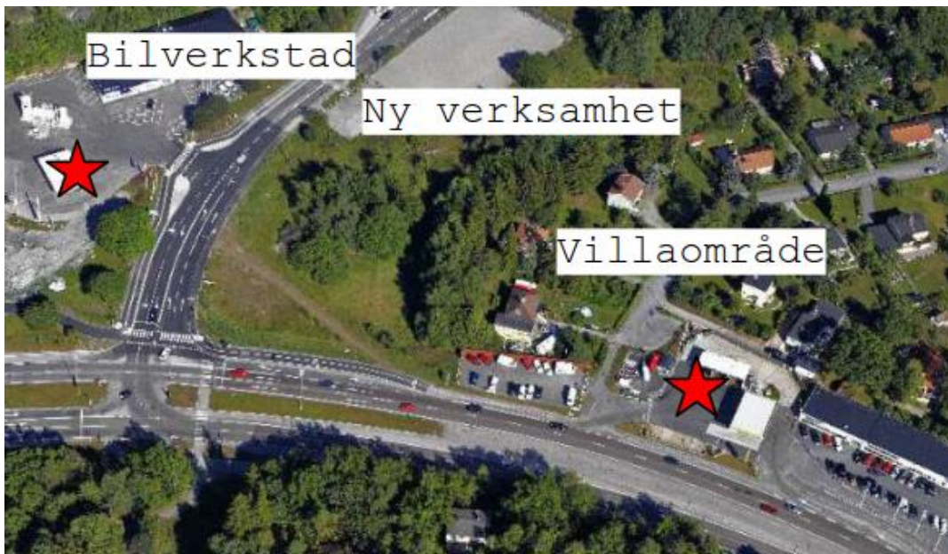
Figur 4 Översiktsskild av området (bensinstationerna har markerats med röda stjärnor). Huddingevägen passerar längs med fotot och Rågsvedsvägen passerar bilverkstaden och ITEX.

I anslutning till byggnadens södra del finns ett naturligt höjdparti med berghällar som avgränsar den tänkta verksamhetstomten från de närbelägna villorna. Höjdskillnaden är dock liten, cirka 1 meter. I naturområdet mellan de närboende och verksamheten finns berghällar, träd och buskar. Mitt i villaområdet finns även en befintlig bensinstation. Se figur 3 nedan för en översiktsskild av villaområdet, bensinstationerna (markerad med en röd stjärna), bilverkstaden och den nya etablerade verksamheten.