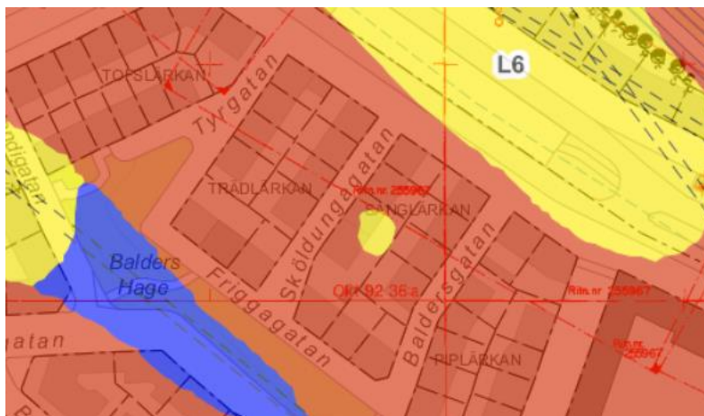
Figur 3: Utdrag ur Stockholms stads byggnadsgeologiska karta. Rött=berg, Gult=lera

Friggatan går på en höjdrygg och marken sluttar relativt brant ner mot Valhallavägen och Östermalmsgatan. Enligt den byggnadsgeologiska kartan för Stockholm består marken av i huvudsak berg. På gården finns dock ett område markerat som lera.