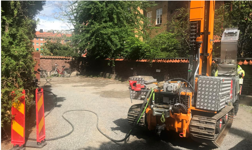
Figur 1 Gård med tegelmur