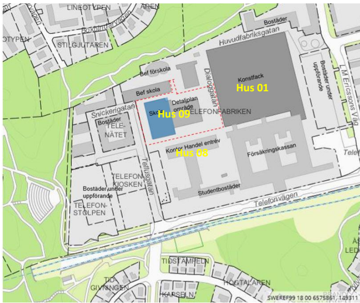
Figur 1. Detaljplaneområdet för området där Hus 09 ligger och området för aktuell undersökning är ovan markerad med röd streckning (ungefärlig utbredning).