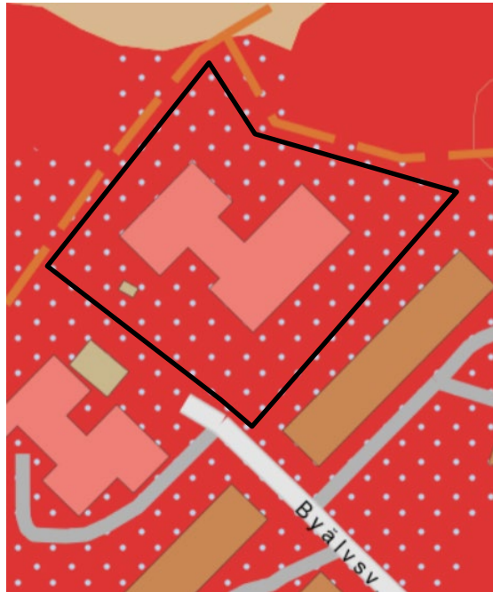
Figur 2. Jordarter inom undersökningsområdet i svart. Rött område visar på urberg, ljusa prickar på ytlager av morän, (SGU, 2018a).