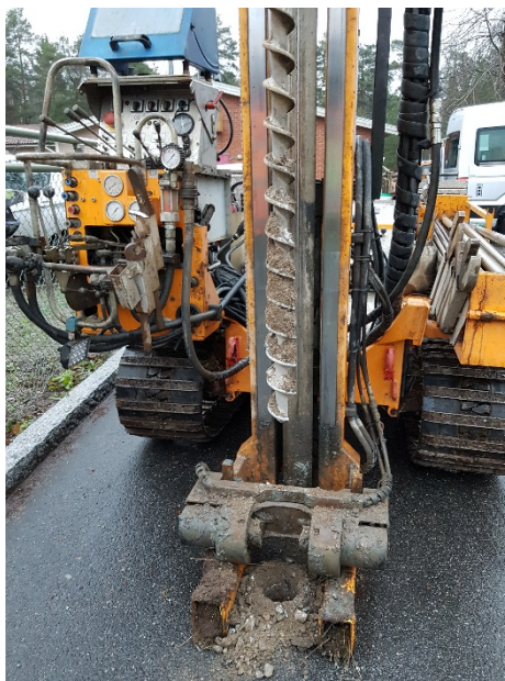
Figur 3. Foto från provtagning av provtagningspunkt 18R01.

Den miljötekniska undersökningen utfördes den 7 december 2018 av personal från Ramboll. Provtagning utfördes med skruvborr monterad på borrbandvagn, se Figur 3. Jordprover uttogs som samlingsprov per meter ner till påträffande av naturlig jord eller berg. Provtagningen utfördes till ett maximalt djup om 1,4 m u my. Berg påträffades i samtliga punkter utförda med borrbandvagn.