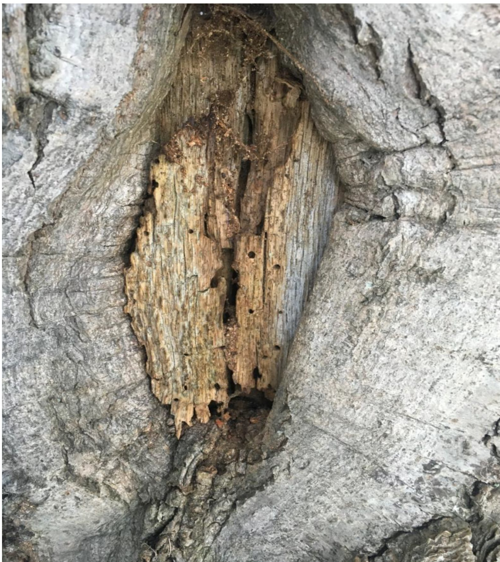
Figur 2. Exempel på en vedblotta med insektsnag. Många ovanliga insekter kräver denna miljö för att leva. Notera det bruna fnaset överst i vedblottan, detta är så kallad mulmbildning. Fotot är taget på Värmdö.

Den döda eller blottade veden är ett viktigt substrat (livsförutsättning) för flera rödlistade svampar och utgör även en hemvist för många naturvårdsintressanta insekter.