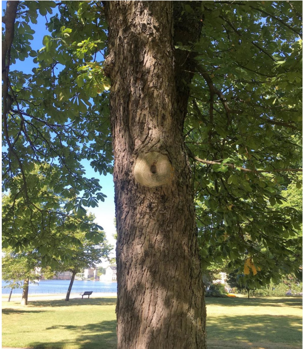
Figur 3. Exempel på påbörjad hålbildning på hästkastanj. Hålet har bildats i en sårkada där en grövre gren har kapats av. Hålet i vedblottan blir gradvis större då svampar etablerar sig och bryter ned veden. Fotot är taget i Eskilstuna stadspark.

Hålträden blir ett grottsystem i miniatyr där en myriad av organismer förekommer. Flera insekter och andra leddjur är speciellt anpassade för den unika miljön. Flera av dessa är rödlistade.