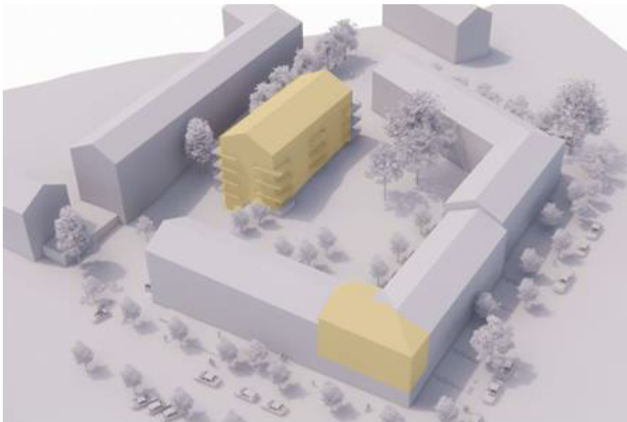
Figur 5. Vy från norr, gulmarkerad byggnad i mitten av bild är planerat gårdshus. I kvarterets norra hörn är gulmarkerad byggnad planerad påbyggnad [2].