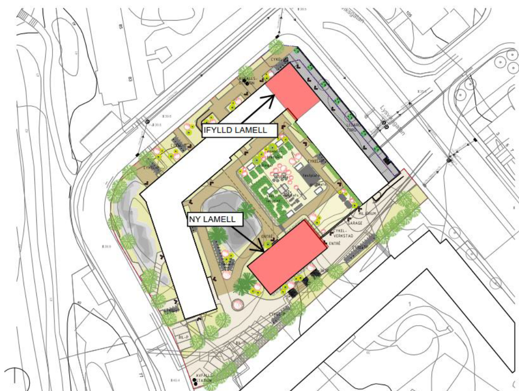
Figur 4. Urklipp från situationsplan, skrafferade ytor i rött är planerade byggnader [4].

Gårdshuset består av fyra våningar från gårdsnivå, fem från nedre nivå samt med en inredd vind, se figur 4–6. Byggnaden planeras att grundläggas delvis på befintlig underbyggd gård och delvis på gårds-/naturmark. Schaktdjup är inte fastställt i dagsläget.