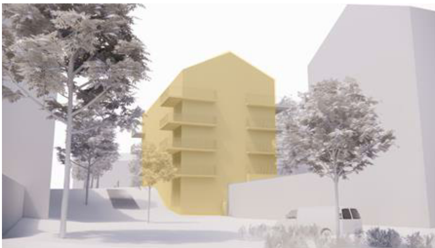
Figur 6. Vy från söder, planerat gårdshus markerat med gult. Ny entréplats och infart till garage på den nedre nivån [2].