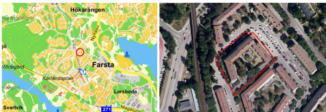
Figur 1. Kartbild och flygfoto över kvarter Ledarö 3, markerat med röd cirkel och polygon (Eniro, 2021)

Föreliggande handling är en arkivstudie baserat på underlag enligt kapitel 3. PM:et omfattar en övergripande sammanställning av geotekniskt underlag, samt en bedömning av markens lämplighet för bebyggelse ut ras- och skredperspektiv. Inför vidare projektering rekommenderas kompletterande geotekniska undersökningar enligt kapitel 6. Underlaget tas fram med hänsyn till de miljö- och hälsofrågor som behöver beaktas och vilka utredningar som behöver göras i samband med att en detaljplaneprocess initieras, enligt Miljöförvaltningen.