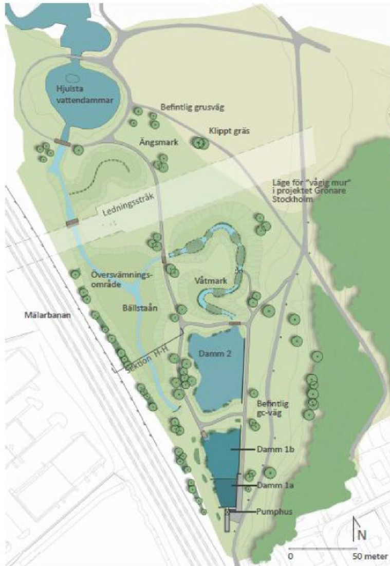
Figur 3 Nytt läge på Bällstaån