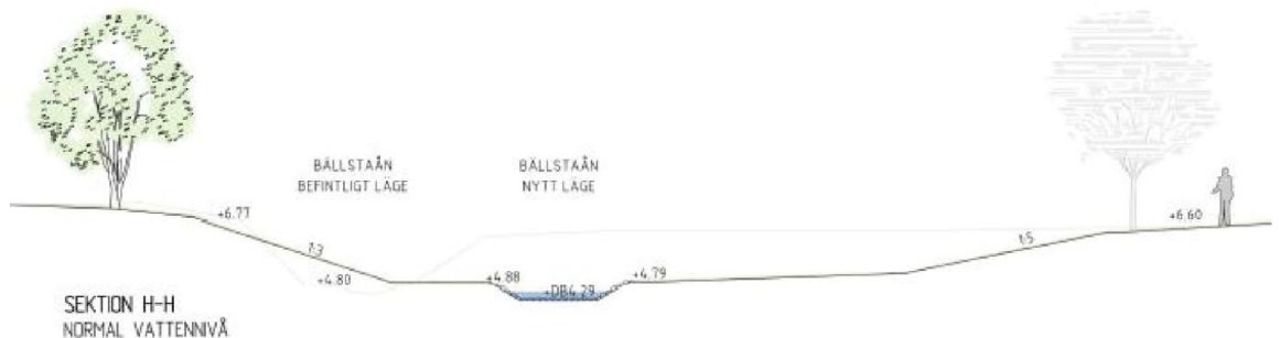
Figur 2 Sektion med Mälärbanan till vänster, nuvarande marknivåsvagt gråmarkerad

I och med att ingen schakt utförs djupare än tidigare dragning av Bällstaån samt att ny bäckfåra kommer flyttas från järnvägen så kommer stabiliteten inte försämrats jämfört med dagens förhållande.