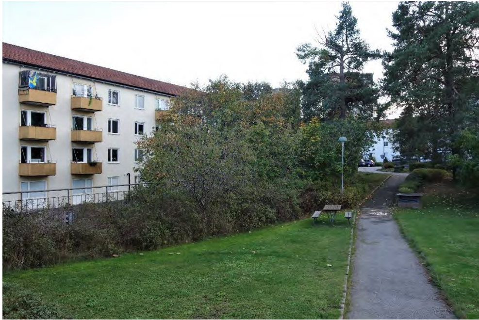
Vy från innergården mot grannfastigheterna Ledarö 1 och 2 (till väster) i oktober 2020.