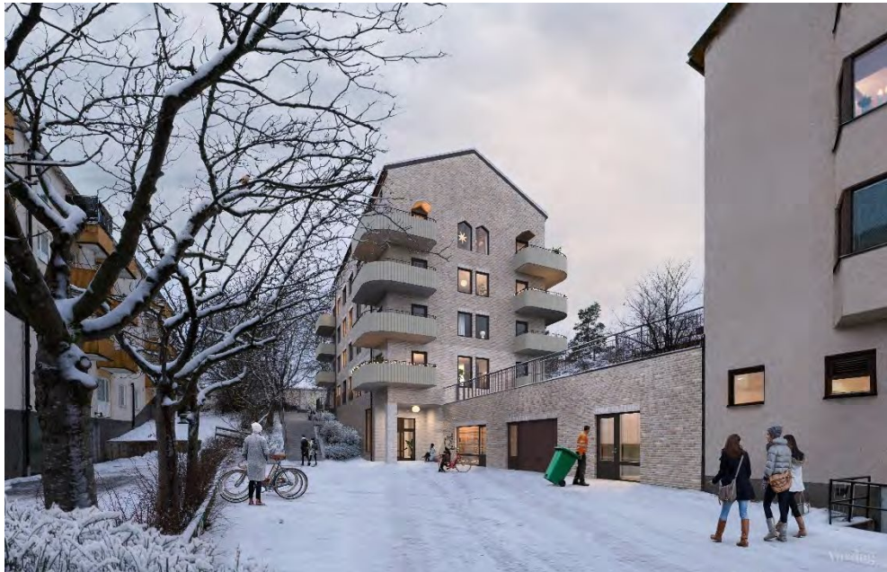
Ungefär samma vy som ovan, men illustrerat med den föreslagna nybyggnaden. Illustrationen är upprättad av Vardag Arkitekter.