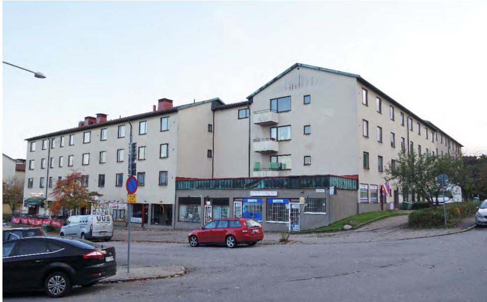
Fastighetens norra hörn i oktober 2020.

Utöver de båda förändringar som beskrivs ovan kommer garagefasaden att omgestaltas i enlighet med gestaltningsprincipen ovan och den del av innergården som ligger ovanpå garaget kommer att moderniseras, vad gäller växtmaterial och funktioner. Dessutom kommer lägena för de ursprungliga groparna för trädplantering utmed butikslängan mot nordost att återskapas.