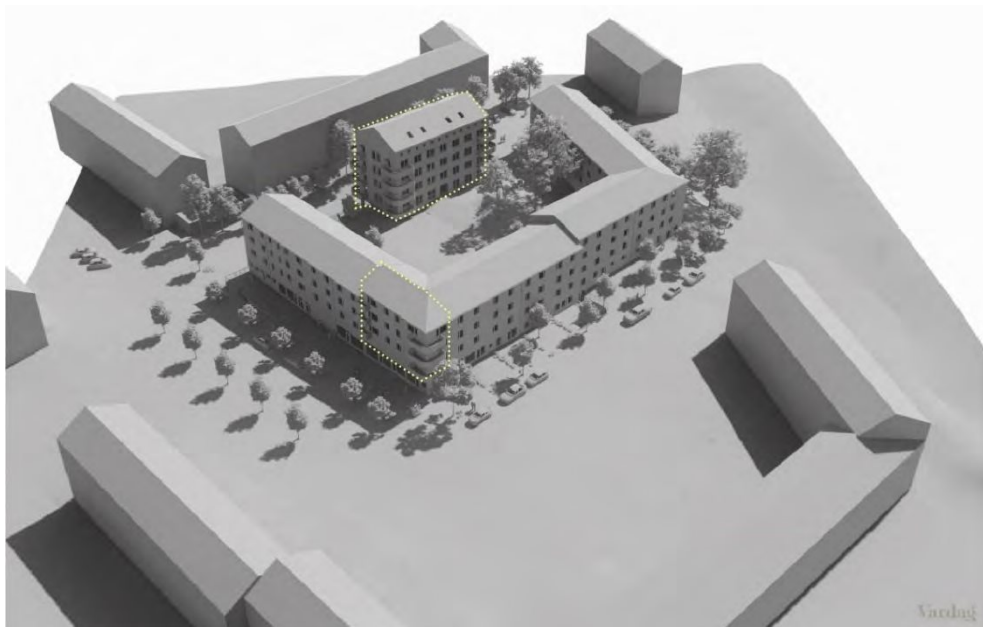
Modellperspektiv med vy från norr, där de båda tilläggen är markerade med gult. Illustrationen är upprättad av Vardag Arkitekter.

Den föreslagna planändringen medger dels att de båda befintliga byggnadskroppar som möts i fastighetens norra hörn kan byggas samman i sin helhet, dels att en ny och fristående byggnad kan uppföras mot grannfastigheterna Ledarö 1 och 2.