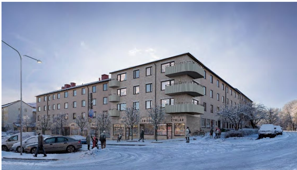
Ungefär samma vy som ovan, men illustrerat med den föreslagna kompletteringsbyggnaden. Illustrationen är upprättad av Vardag Arkitekter.