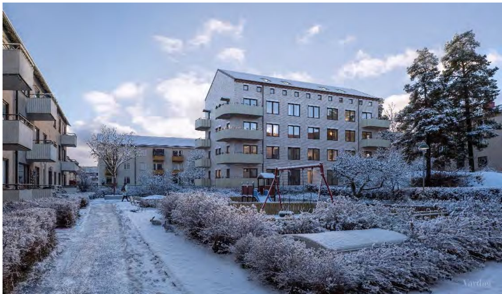
Ungefär samma vy som ovan, men illustrerat med den föreslagna nybyggnaden. Illustrationen är upprättad av Vardag Arkitekter.