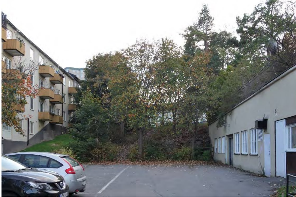
Utrymmet mellan Ledarö 3 (till höger) och grannfastigheterna Ledarö 1 och 2 (till vänster) i oktober 2020.