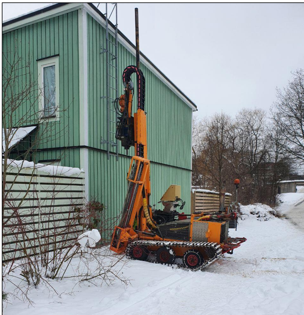
Figur 3: Provpunkt 3 med en illustration av rådande väderförhållanden.

Provtagning skedde den 19 februari. Området är dominerat av hårdgjorda ytor omgivna av flerfamiljehus och vad som ser ut att kunna vara en gammal kontorslokal, området för provtagningen befinner sig i en svagt sydligt lutande sluttning. Enstaka anlagda grönområden finns mellan de hårdgjorda ytorna. Lufttemperaturen under dagen uppmättes till omkring 5 grader. Ingen nederbörd. Tunt snötäcke (<5cm) se, (figur 3). Fyllnadsmassorna bestod av sandigt material med mindre klaster (~3cm) fullt utspridda i markmatrisen. Lerlagret som framträdde cirka en meter ned var grått och hade låg till inget organiskt innehåll – Leran uppskattas vara av glacial typ.