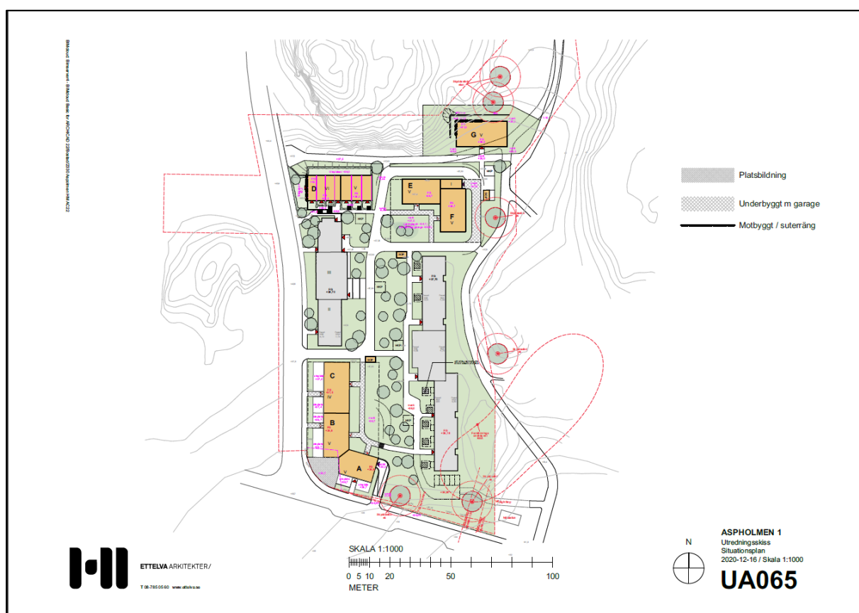
Figur 1: Situationsplan med planerad exploatering.

Envigo AB ("Envigo") har på uppdrag av Vårlöv kommanditbolag ("Vårlöv") genomfört en avgränsad markteknisk undersökning av fastigheten Aspholmen 1:1, i Vårberg, Stockholms stad. Undersökningen sker som ett förarbete inför vidare exploatering av fastigheten där bland annat underjordiska parkeringsytor planeras att konstrueras ( figur 1 ). Undersökningen har involverat litteraturstudier och genomgång av befintligt material, såsom jordartskartor, samt platsbesök med skruvborrprovtagning den 19:e februari 2021. Vid platsbesök genomfördes okulärbesiktning av de lokala förutsättningarna samt markens karaktär. Uttagna och insamlade prov lämnades hos ALS Scandinavia i Danderyd, Stockholm.