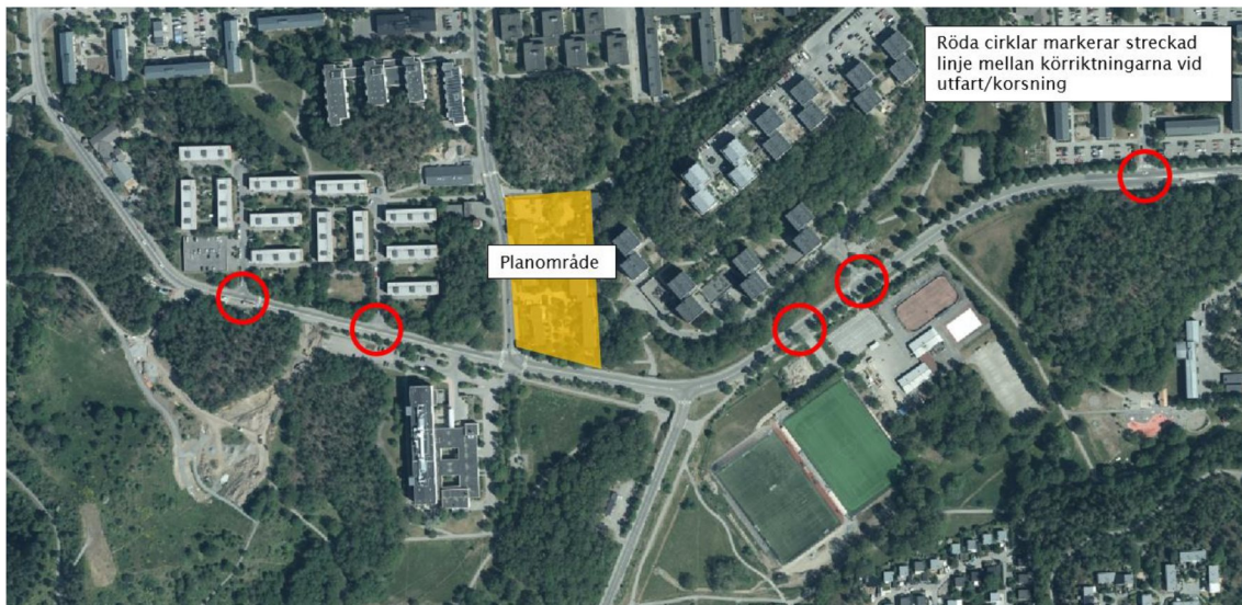
Figur 3 - Exempel på streckade linjer mellan köriktningarna vid utfart/korsning. Observera att detta endast är några exempel längs Vårbergsvägen.

Siktförhållandena vid planerad infart till garaget bedöms efter en översiktlig kontroll vara goda. Figur 4 visar sikten österut respektive västerut.