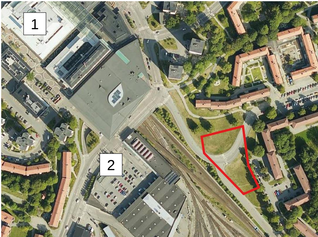
Figur 1-1 Fastighetens läge (rött) i relation till Vällingby centrum (1) och Åregaraget (2). Solursgaraget ligger norr om fastigheten (utanför bild). Källa för karta: Eniro, bearbetad av Trivector.

Svenska Bostäder planerar för bostäder inom Firman 1, i närheten av Vällingby Centrum. Projektet omfattar cirka 110 lägenheter, upplåtelseformen är hyresrätter och parkering för boende planeras att lösas genom servitut i det närliggande Åregaraget alternativt Solursgaraget. För mer information om dessa parkeringsanläggningar, se Bilaga 1.