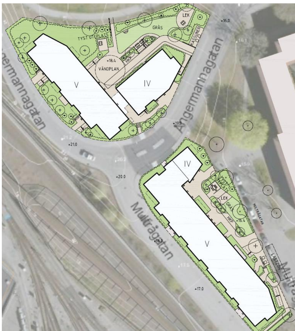
Figur 1-2 Planerad exploatering inom fastigheten, med två flerbostadshus på vardera sida av Angermannagatan.