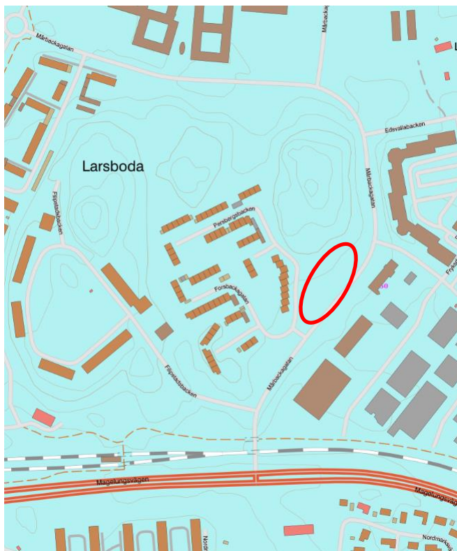
Figur 1. Berggrundskarta. Cyan – vacka. Källa SGU, 2020-07-03. Det aktuella området är markerat med en röd cirkel.

Den berggrundsgeologiska kartan redovisar berggrunden i ett större område och det saknas därför information om inslag av t ex gångbergarter eller sprickmineral.