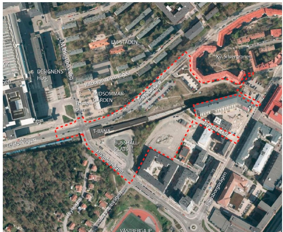
Ortofoto med preliminär avgränsning av planområdet (röd streckad linje). Tunnelbanans befintliga station ligger i korsningen Mikrofonvägen och Telefonvägen.

Förslaget syftar även till att pröva lämpligheten i att skapa ett nytt landmärke i form av två 78 respektive 58 våningar höga bostadstorn i denna del av Stockholms stad. Landmärken kan vara av symbolisk kraft. Mot bakgrund av områdets historia och kulturhistoriskt värdefulla miljöer, är ambitionen att förslaget ska bidra till Stockholms utveckling samtidigt som bebyggelsens struktur och utformning arkitektoniskt ska förvalta, förnya och förstärka identiteten i området kring Telefonplan.