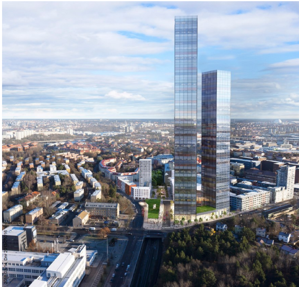
Illustration över situationsplanens föreslagna kvarter och bebyggelsevolym (sett från väster). Illustration: Wingårdhs och Varg Arkitekter.