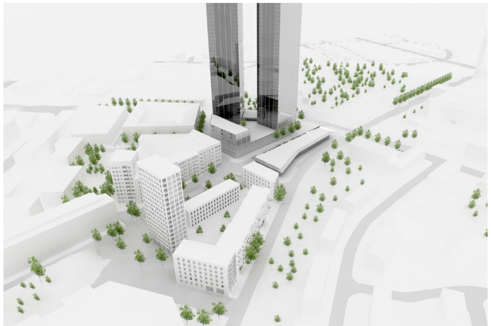
Illustration över situationsplanens föreslagna kvarter och bebyggelsevolym (sett från nordost). Illustration: Wingårdhs och Varg Arkitekter.