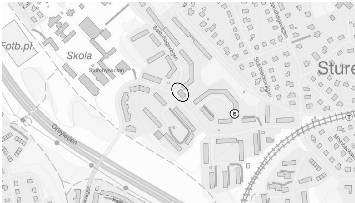
Figur 3. Utdrag från länsstyrelsens webb-GIS med redovisning av potentiellt förorenade områden. Svart cirkel markerar Farfarstäppan 2 och omgivning. Inga noteringar finns i fastighetens närområde.

I Länsstyrelsen Ebh-underlag (potentiellt förorenade områden) finns det inga riskklassade verksamheter inom fastigheten eller i närområdet till aktuell fastighet (se fig 3 nedan). Närmsta identifierade verksamhet finns på Bäckaskiftesvägen 21 – kategori övrigt (BKL 4).