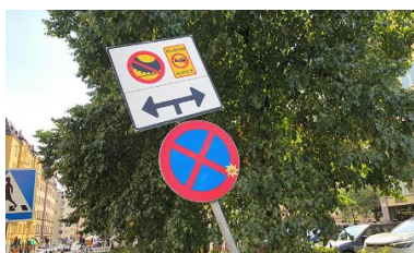
Dubbdäcksförbud och miljözon