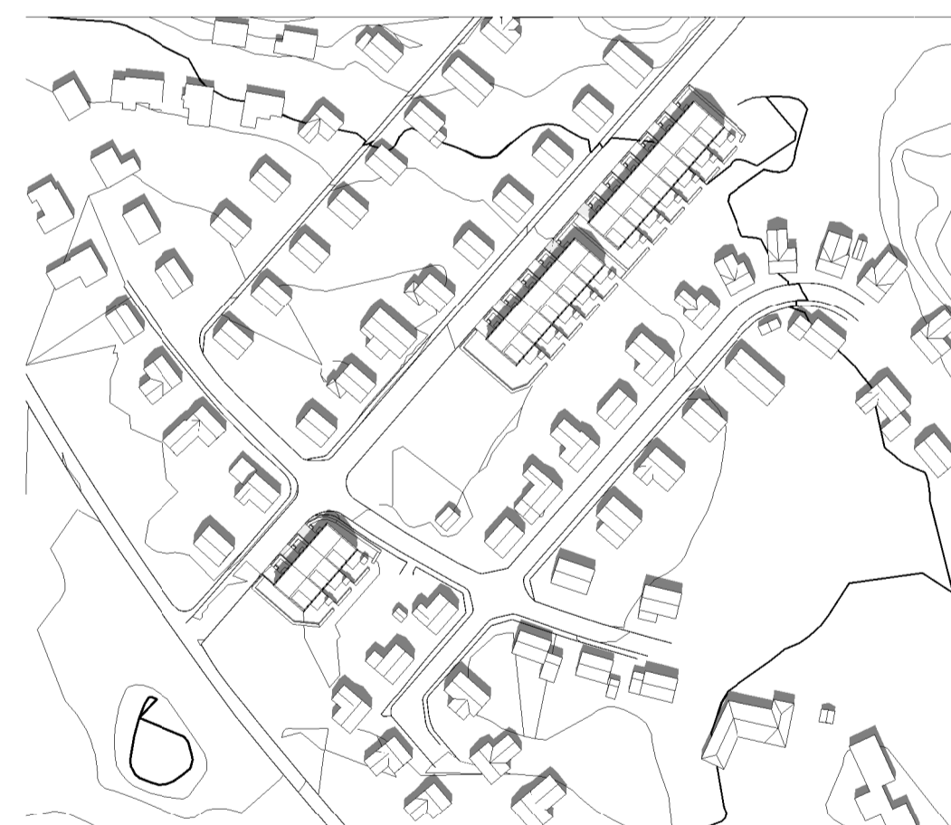
Sommarsolstånd kl 12