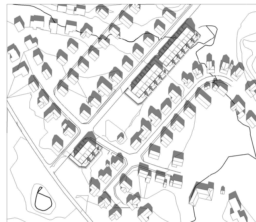
Vårdagsjämning kl 12