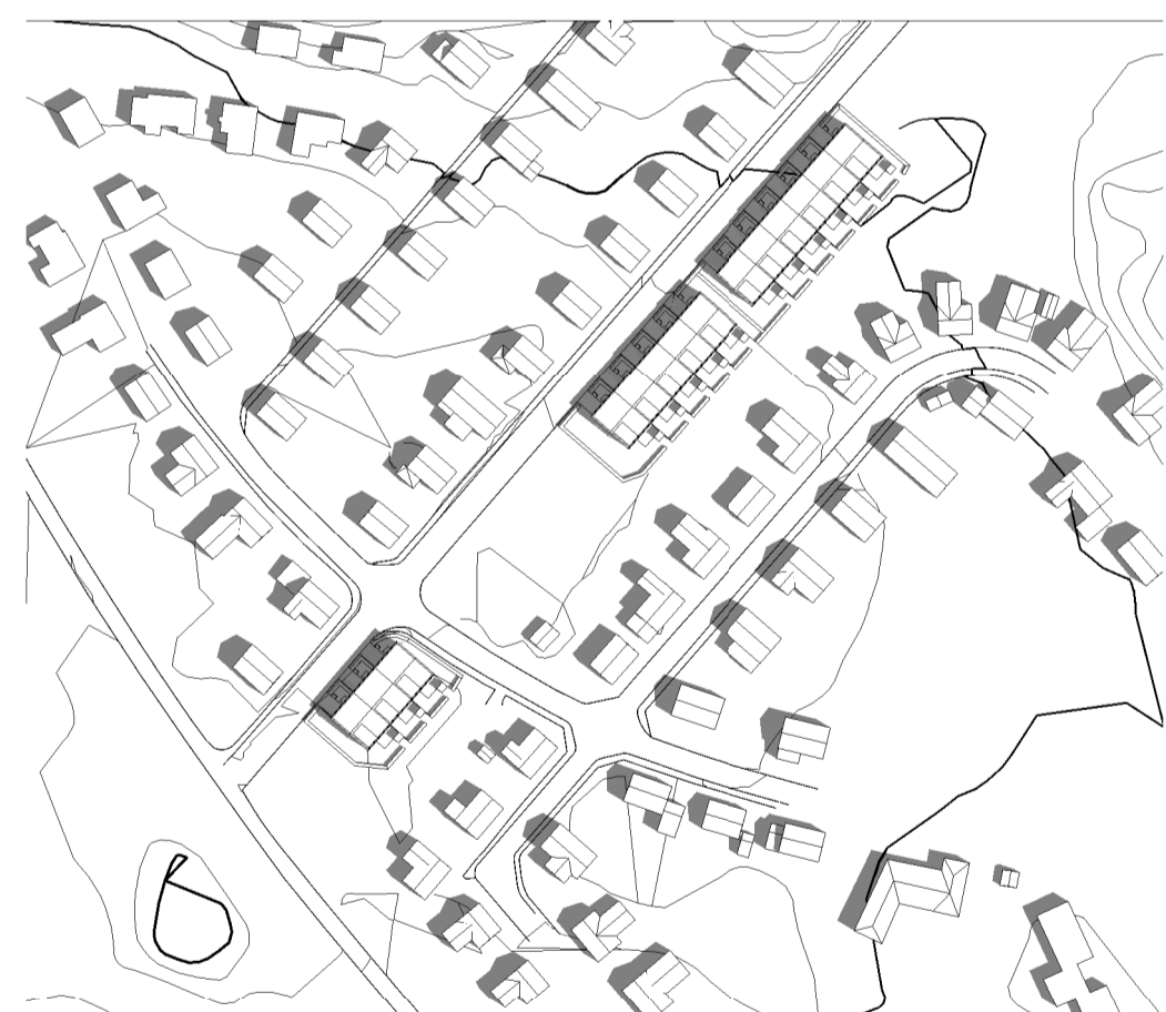
Sommarsolstånd kl 9