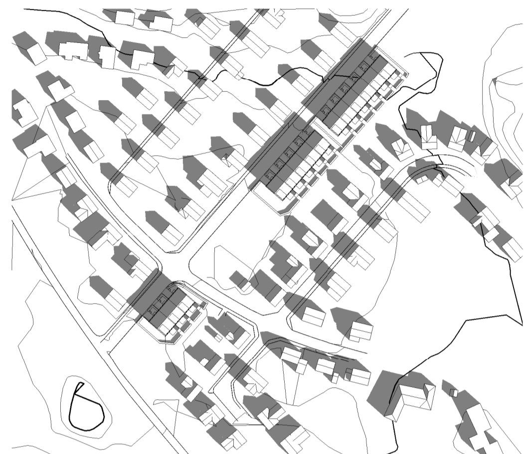
Vårdagsjämning kl 9