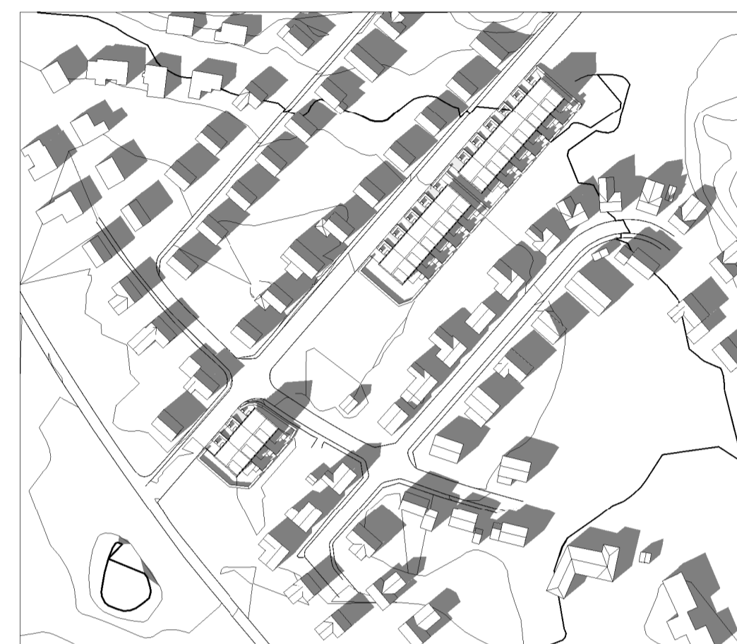
Vårdagsjämning kl 15