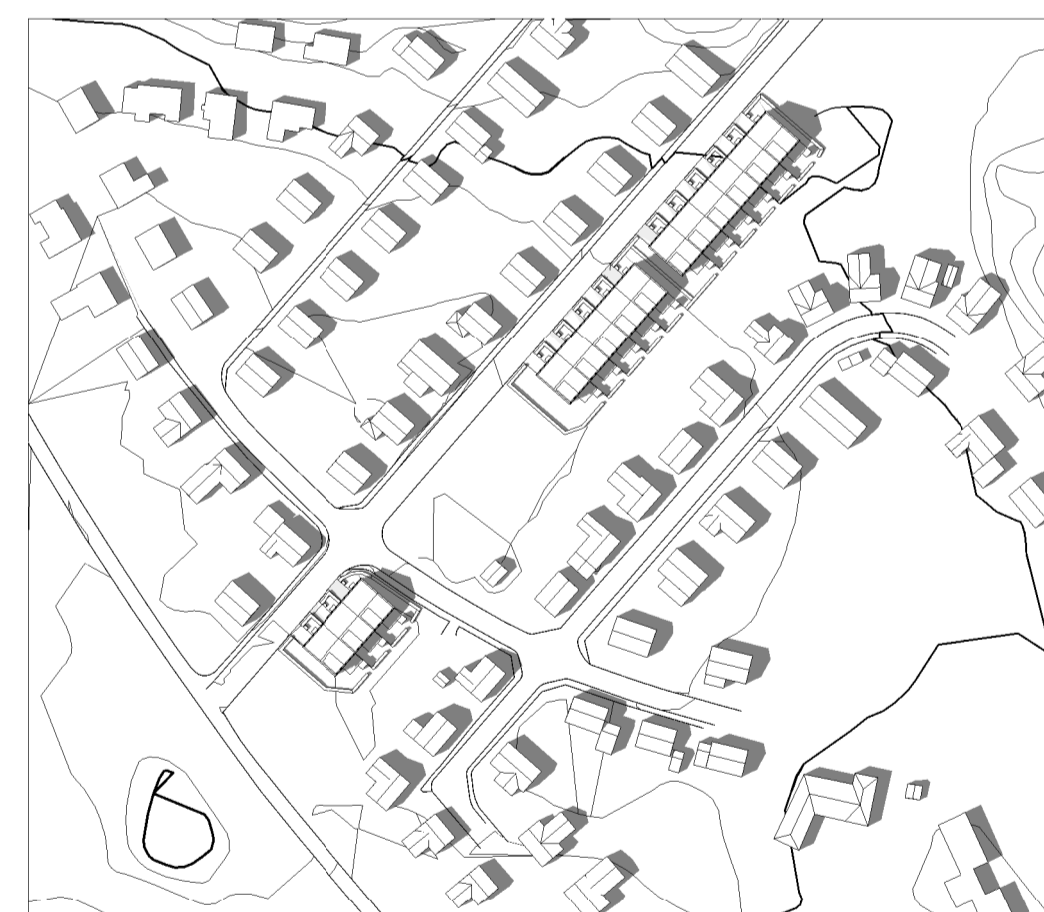
Sommarsolstånd kl 15