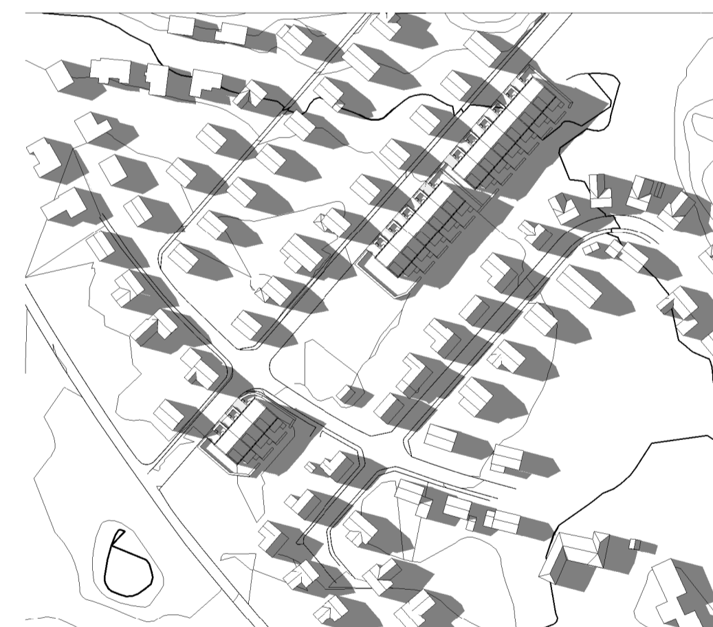
Sommarsolstånd kl 18