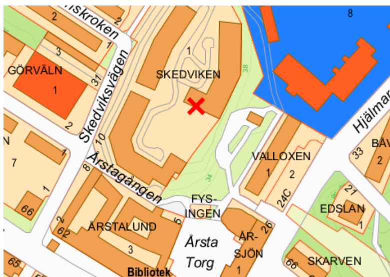
Bild: Kartbild med gruppboستaden markerad med X

En befintlig gruppbostad på entreprenad, som tillfälligt är evakuerad till det före detta Rågsveds servicehus på Kumlagatan 17 i Rågsved, är i stort behov av att flytta till ett permanent boende med modern standard. Planen är att flytta till Skedviksvägen 50 när renoveringen är klar. I samband med flytten kommer verksamheten att utökas från fem till sex boendeplatser, vilket innebär att en ny plats skapas.