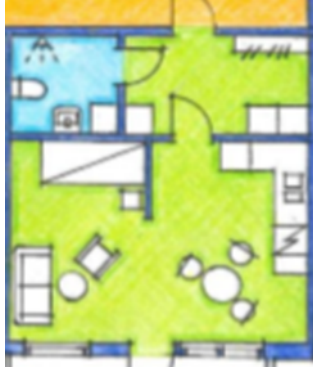
Ritning Kulltorps stödboende. Två olika lägenheter.