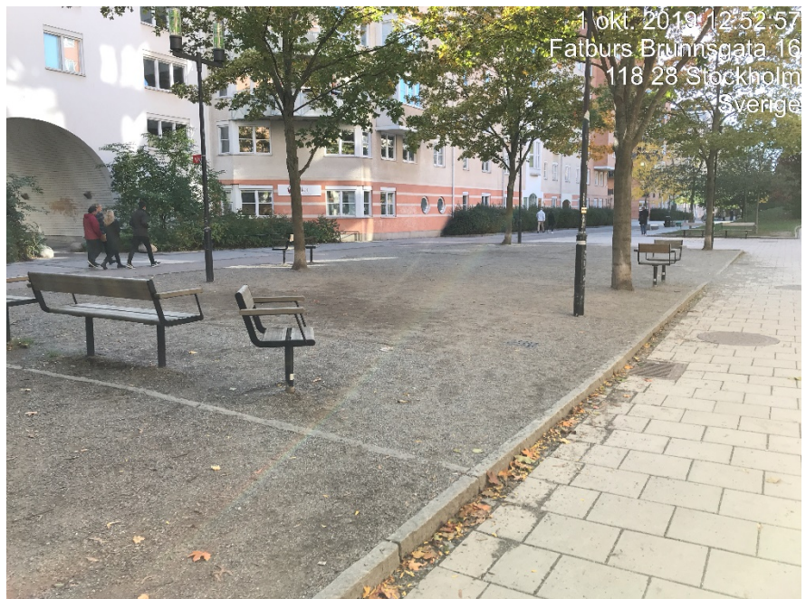
Bild från platsen i Södermalmsallén där boule kan spelas.

Om fler ytor för bollspel skulle anläggas behöver grönytor tas i anspråk. Förvaltningen anser att det finns ett värde i att befintliga grönytor i Södermalmsallén bibehålls, detta då bland annat hela allén utgör en lågpunkt vid större skyfall och därmed behövs grönytorna för infiltrering av dagvatten. I Parkplan Södermalm anges dessutom att vegetationen i Södermalmsallén på sikt bör utvecklas. Mot bakgrund av ovanstående anser förvaltningen inte det vara lämpligt att ta ytterligare ytor i anspråk för bollspel i allén.