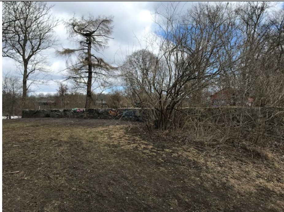
Buskage i behov av beskärning.