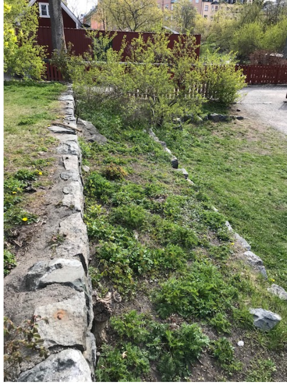
Trasig mur och rabattyta där buskar saknas.