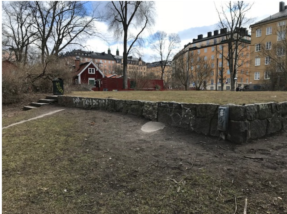
Platå som saknar aktiviteter.