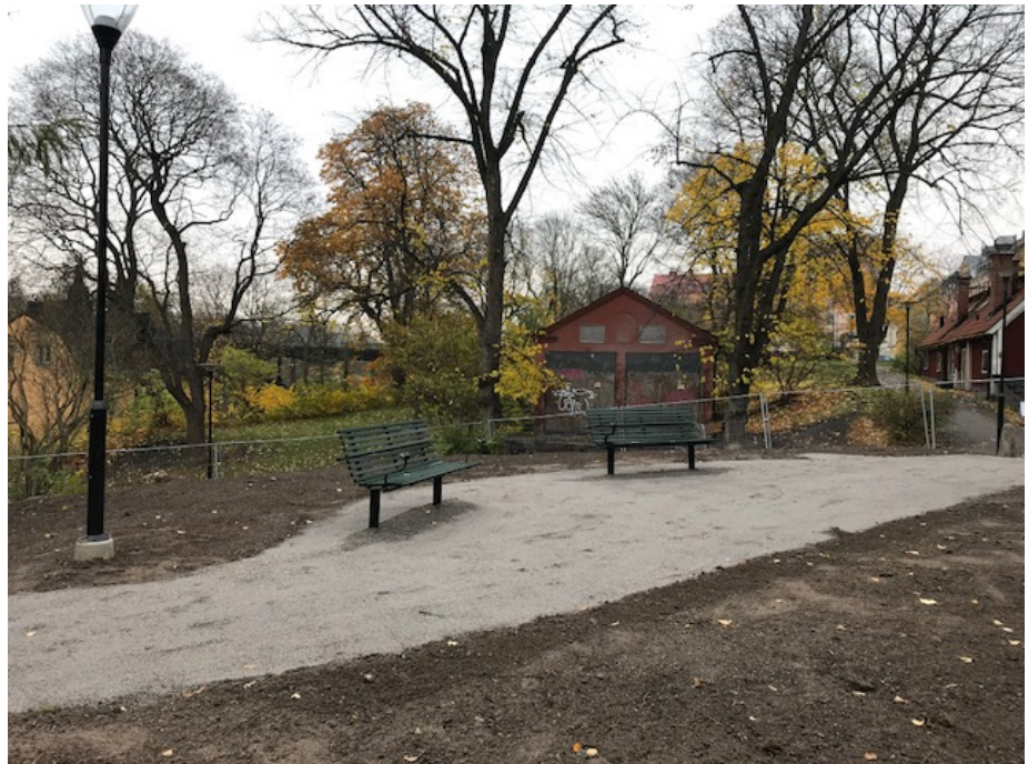
Nya sittplatser, ny belysning samt ny grusgång.