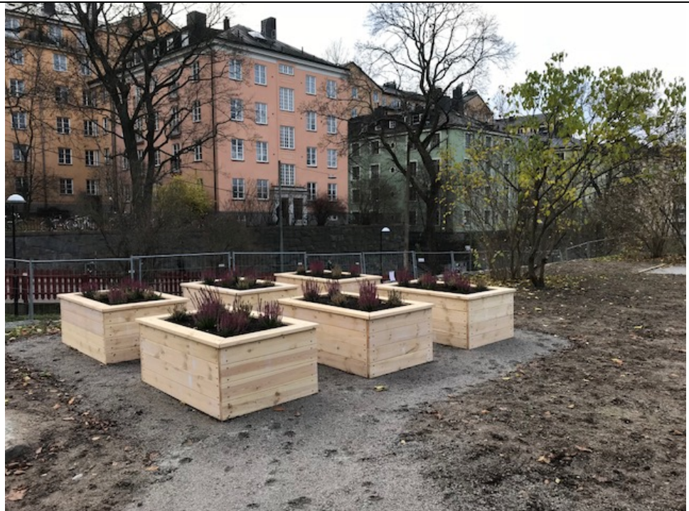
Nya odlingslådor till stadsodling.