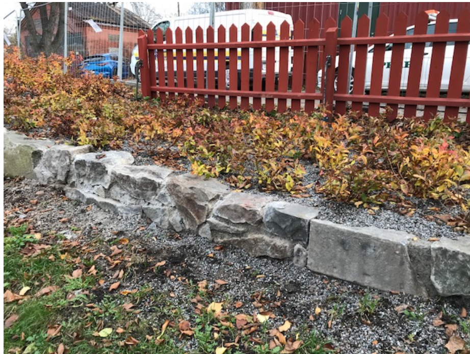
Ny buskplantering och lagad mur.