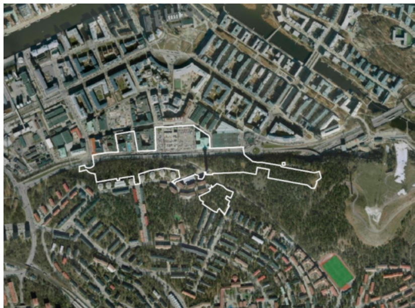
Flygbild med planområdet i vit linje.

Planområdet omfattar cirka 9,7 hektar och gränsar i norr mot kvarteren norr om Hammarby Fabriksväg och mot Virkesvägen samt i öster och väster mot Hammarbymotet respektive cirkulationsplatsen vid Textilgatan. Mellan Hammarby Fabriksväg och Virkesvägen innefattar planområdet två kvarter. Planområdets södra del omfattar del av slänten upp mot Hammarbyhöjden söder om Hammarbyvägen.