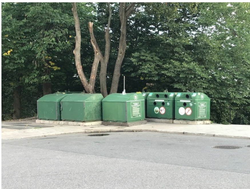
Bild från hörnet Södermannagatan/Bohusgatan vilken i förslaget föreslås utvecklas.

Nedan visas en bild från hörnet Södermannagatan/Bohusgatan vilken föreslås utvecklas samt en karta med platsens placering.