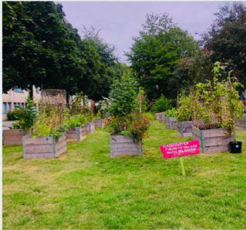
Kolonilotter med sittplatser