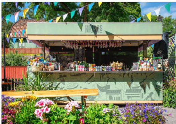
Torg med kiosk eller plats för umgänge