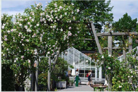
Växthus med café och äppeträd