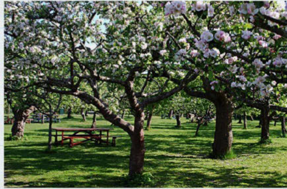
Park med sittplatser under äppelträd