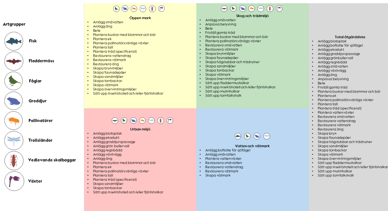
Figur 3. Kategorisering av åtgärdsförslag för olika artgrupper och i olika biotop typer. Se större bild i rapporter över stadsdelsvisa åtgärdsförslag.