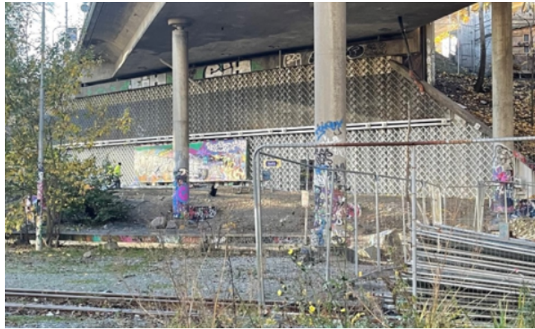
Bild på den öppna väggen från 2022 efter det att spaljén satts upp..

brokonstruktionen. Nedan visas en bild på brokonstruktionen med uppsatt träspaljé.