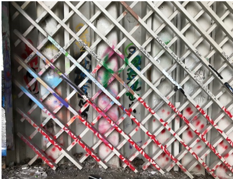
Bild på otillåten målning utanför den öppna väggen.

Mot bakgrund av ovannämnda anser förvaltningen att det i dagsläget inte är lämpligt att förlänga väggen vid Skanstull.