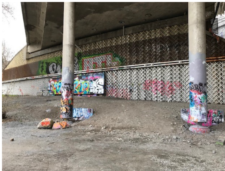
Bild på den öppna väggen.

Förvaltningen kan konstatera att området kring den öppna väggen tydligt är utsatt för otillåten målning, trots tillförd träspaljé (se bilder nedan). Även om ytan för den öppna väggen skulle utökas bedömer förvaltningen att problem med otillåten målning utanför väggen skulle kvarstå.