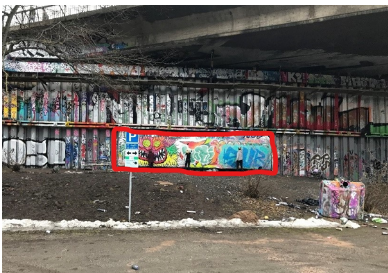
Bild på den öppna väggen under Skansbron. Den avsedda väggen är markerad med röd ram.

På kartan markeras den öppna vägens placering under Skansbron med ett rött kryss.