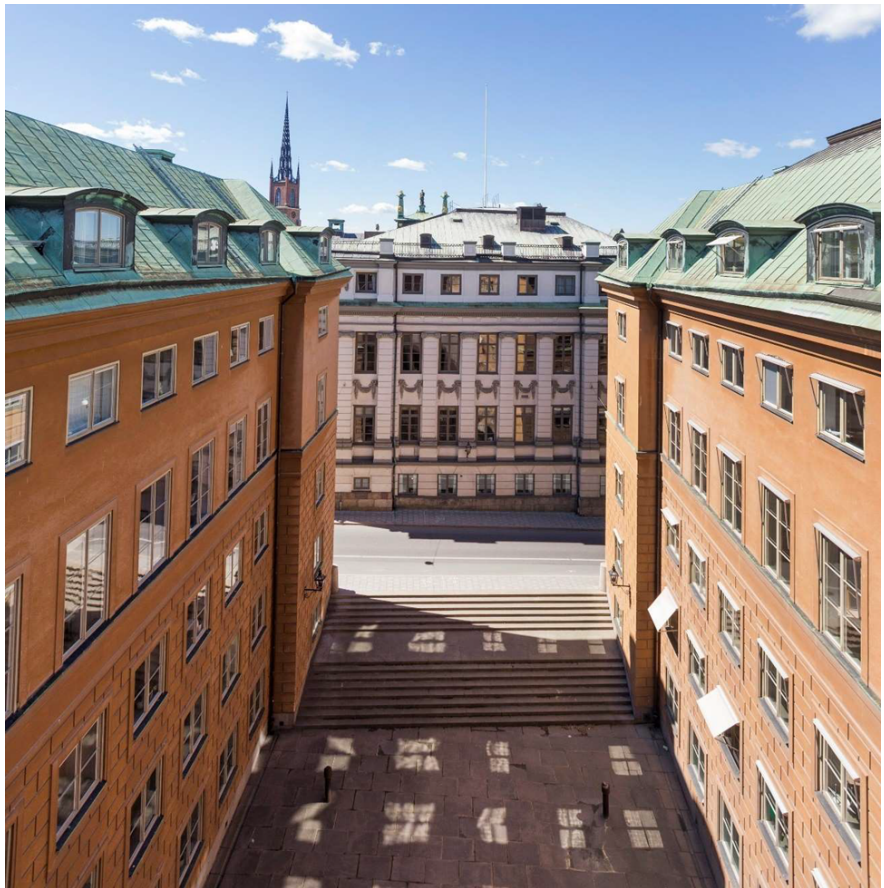
Västra gården innan ombyggnationen 2018-2022.