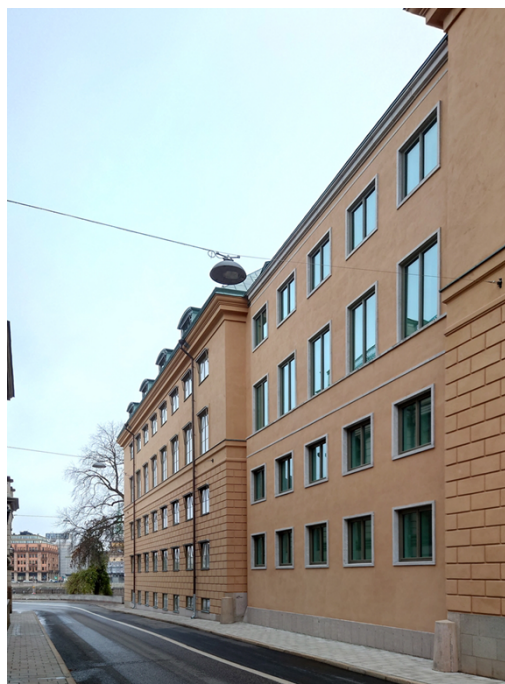
Fasad mot Rådhusgränd.