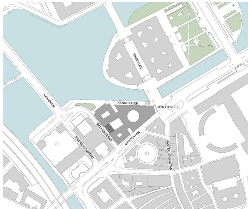
Illustration med aktuell tillbyggnad i mörkgrå markering. Illustration: White.

Tillbyggnaden består av fem våningar varav en i suterräng mot gatan. Flyglarna som omgärdar den västra gården byggs samman med fler lokaler för riksdagens ledamöter och mot gården tillgodoses också behovet av en ny hörsal inom Riksdagsförvaltningens bestånd med plats för cirka 100 personer. Hörsalen ska vara tillgänglig för besökare.