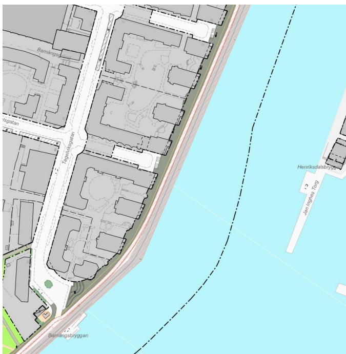
Karta 3: Sträckan Barnängsparken till Nackagatan.