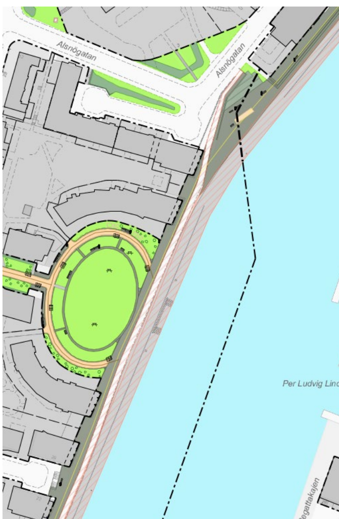
Karta 4: Sträckan Nackagatan till Alsnögatan.

Södermalms Stadsdelsförvaltning Stadsmiljö