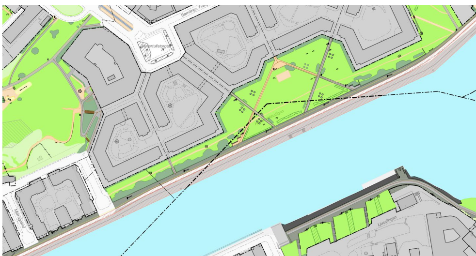
Karta 2: Sträckan Mjårdgränd till Barnängsparken.