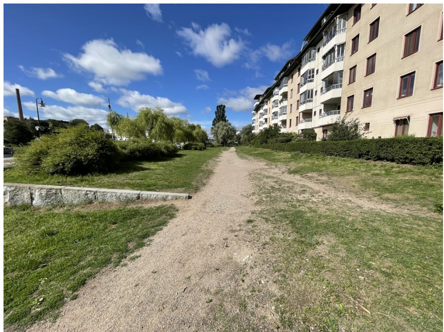
Stigen sedd åt sydväst från lila prick i satellitfotot ovan.

Några meter söder om stigen finns anlagda stråk för gående och cyklister på kajen. Även kollektivtrafik finns nära då busslinje 57 trafikerar delar av kajen. Förvaltningen anser att gående och cyklister i första hand ska gå på kajen för att inte skada och slita på gräsyterna.