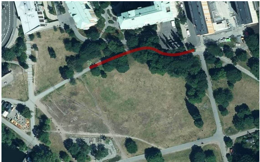
Demokratistråket sattes upp längs den rödmarkerade gångvägen