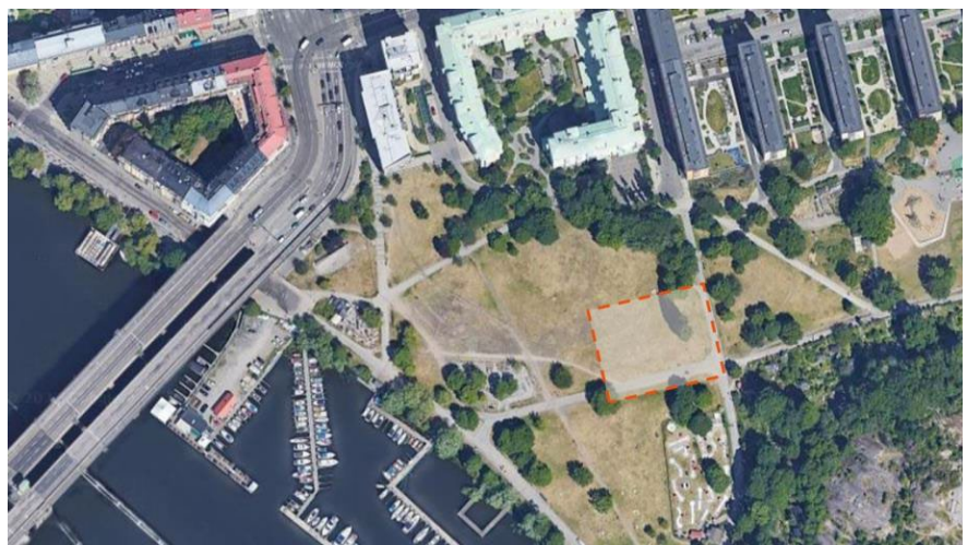
Evenemangsytan visas ovan

Genom ”Sommar i Tanto” har det funnits platsaktivering mellan den 5 juni och 25 augusti 2023. Det har varit bemannat mellan klockan 11.00 och 21.00 på måndag till lördag och mellan klockan 11.00 och 18.00 på söndagar. Aktiveringen har till stor del fokuserats runt en så kallad evenemangsyta.