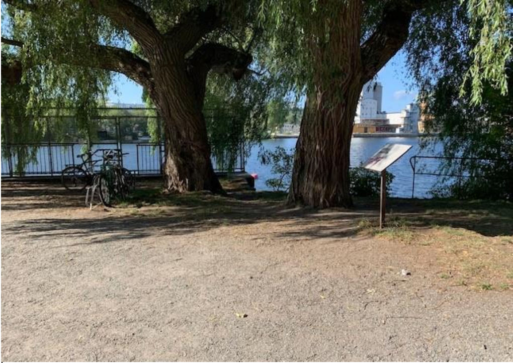
Bild 5. Bilden visar ytan söder om boulebanan, där en tänkbar nedgång till en av kajbalkongerna skulle kunna placeras.