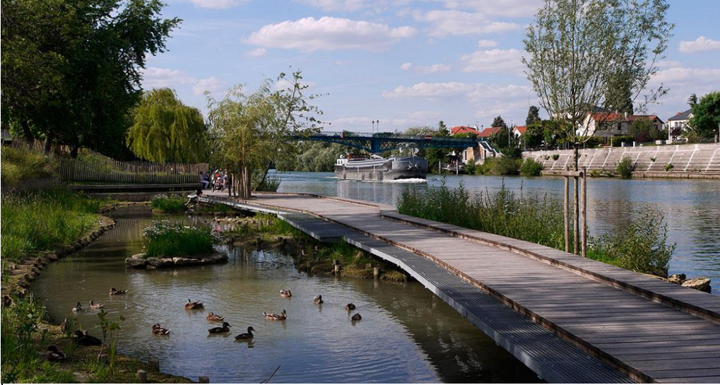
Bild 4. Inspirationsbild med exempel på bryggpromenad ritad av BASE Landcpe Architecture och anlagd i Perreux-sur-Marne i norra Frankrike.