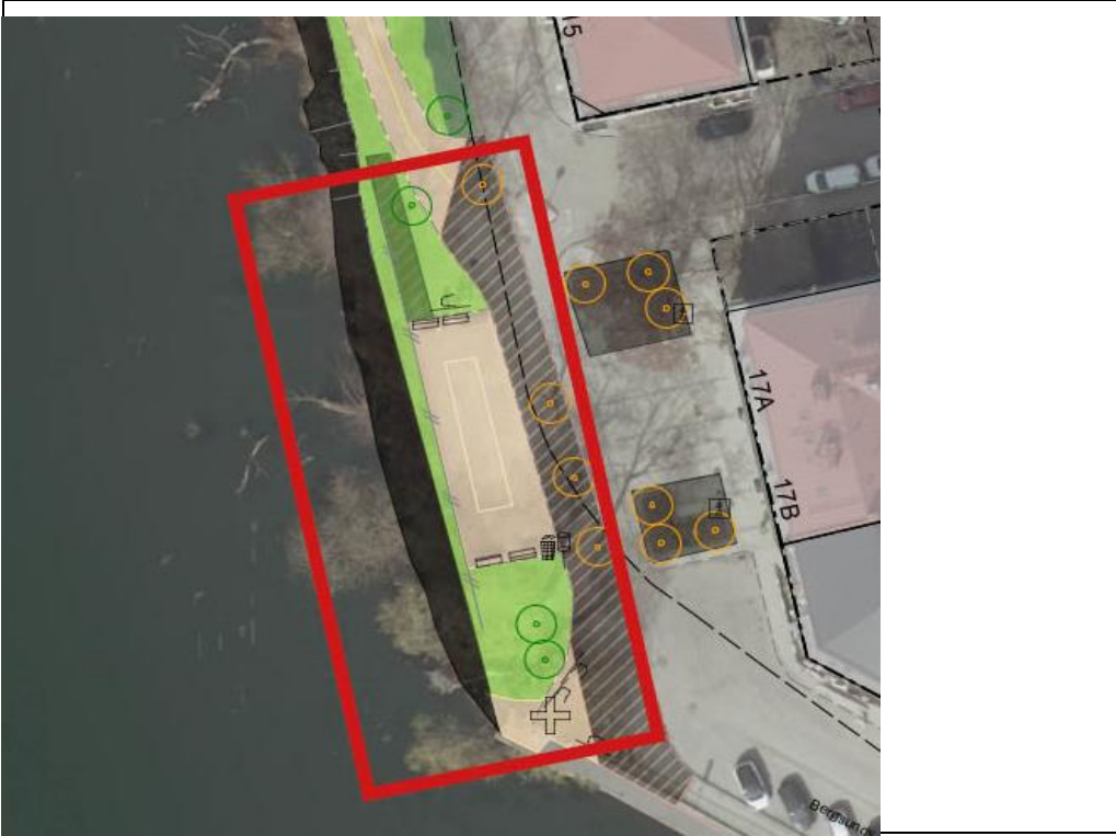
Karta 2. Inzoomad kartbild där röd markering visar aktuellt område i södra delen av Bergsunds strand.

Boulebanan har blivit en samlingsplats för grupper med alkohol- och blandmissbruksproblematik, vilket även attraherar handel med droger. Närheten till Frälsningsarméns sociala center på Långholmsgatan, Systembolaget i Hornstulls centrum och sprututbytet vid Beroendecentrum på Maria Prästgårdsgata ett stenkast bort är bidragande orsaker. Problematiken vid Bergsunds strand finns också i ett samband som sträcker sig via Hornstulls strand och in i Drakenbergsparken och Tantolunden.