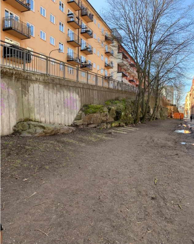
Bild 4. På bilden ses tydliga spår av hur människor väljer att använda gräsytan då gång- och cykelstråket är för smalt. Detta leder till att gräsytan slits ner och blir till ett stampat jordgolv. Slitaget bidrar till upplevelsen av otrygghet.