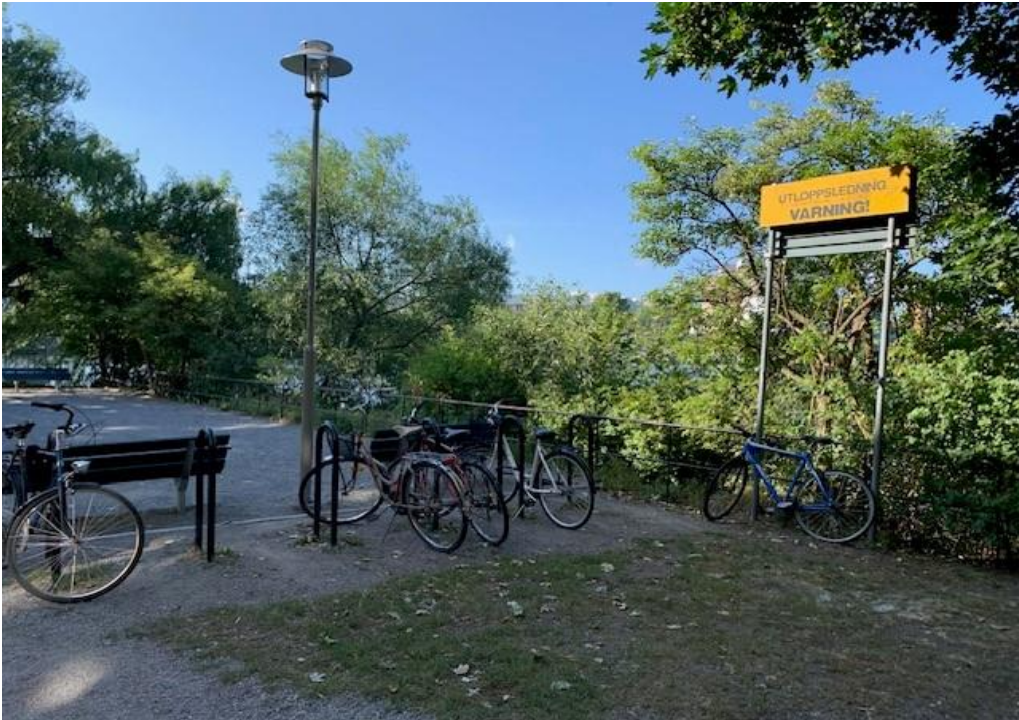
Bild 1. Boulebanan är i dagsläget omgärdad av bänkar och cykelparkering, vilket bidrar till att den upplevs som avskärmad från det övriga parkstråket.