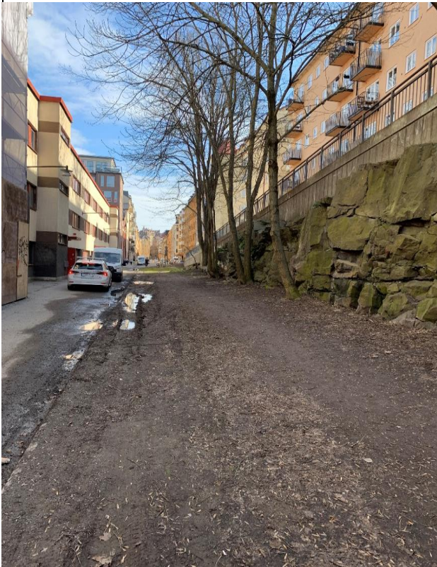
Bild 3. På bilden ses hur bilar parkerar längs med gång- och cykelstråket och blockerar möjligheten till passage. Detta bidrar till att fotgängare och cyklister tvingas ut på grönytan. Den leriga gräsytan visar även tydliga spår efter bilar som kört där.