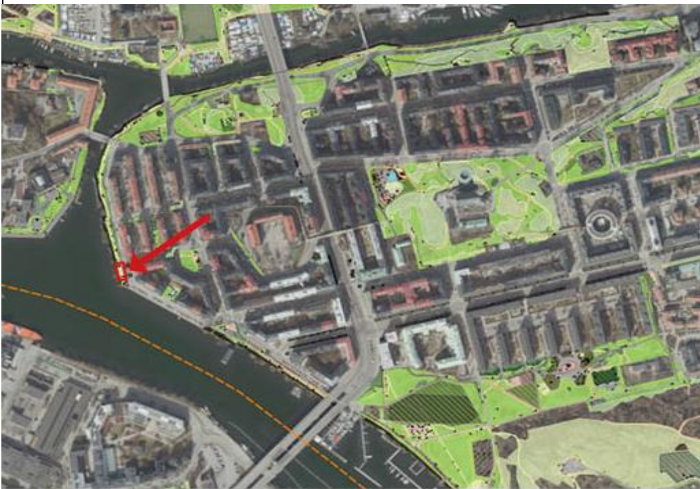
Karta 1. Röd markering visar aktuellt område på västra Södermalm.

Parkstråket används flitigt för både passage och vistelse. Den uppvuxna, lummiga grönskan, närheten till vattnet, kvällssol och utblick mot vattnet gör det till en attraktiv plats. I söder inleds stråket med en rektangulär, grusad yta som ramas in av bänkar på vardera kortsida, i dagsläget används denna som boulebana. Det är den ytan som vi fokuserar på i det här projektet.