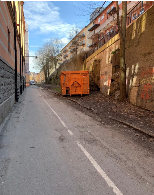
Bild 1. Stråket upplevs smalt och otryggt. Kombinationen av att stråket avgränsas av en hög bergvägg och en fasad med brist på fönster inger en låg känsla av social kontroll från omgivande fastigheter. Kvälls- och nattetid blir stråket mörkt då inte heller något spill-ljus från omkringliggande fastigheter hjälper till att lysa upp platsen.