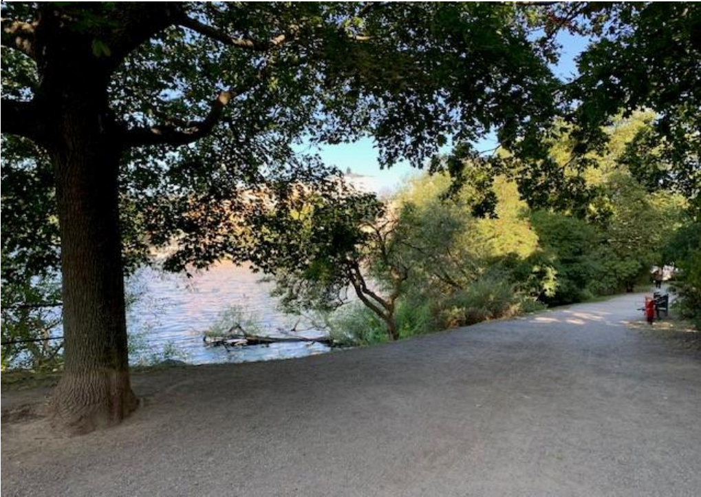
Bild 4. Bilden visar hur Bergsunds strands promenadstråk tar vid i boulevananans norra del. Här skulle kopplingen mellan boulevanan och promenadstråket kunna göras tydligare. Det här är även en tänkbar nedgång till en av kajbalkongerna. Utblickar mot vattnet skulle kunna tas fram.