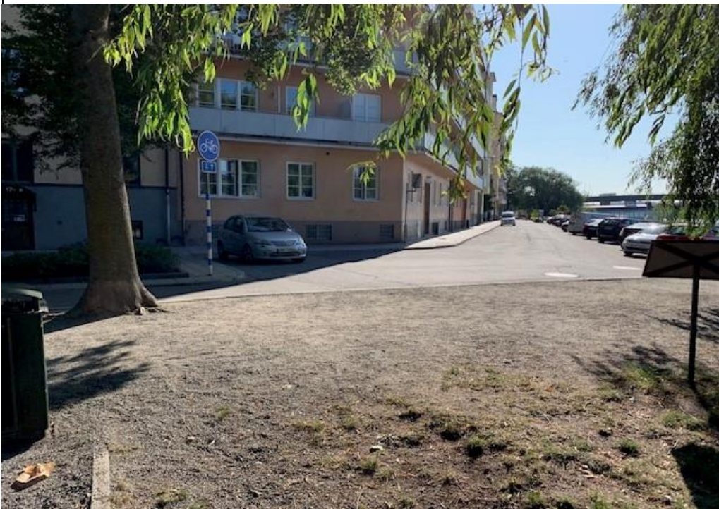
Bild 2. Bilden visar övergången mellan boulebanan och parkeringen. Genom det här projektet och en utökning av Levande Stockholm skulle kopplingen kunna förstärkas.