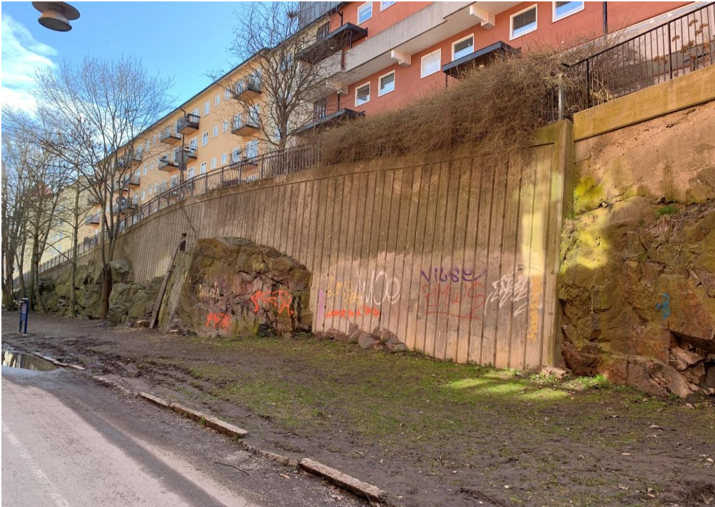
Bild 2. Avgränsningen mot övre delen av Maria Prästgårdsgata består av berg i dagen och av en betongmur. Höjdskillnaden varierar. Här syns även gräsytan som körs sönder av olika transporter.