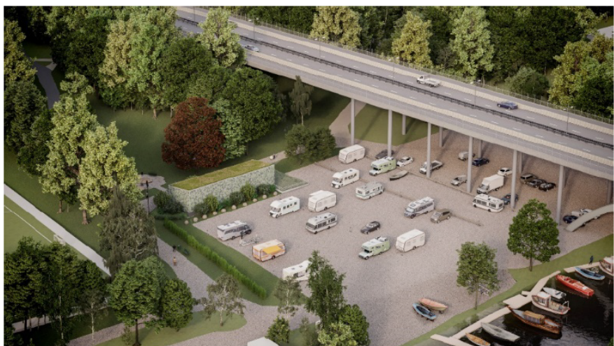
Figur 2. Visualisering av teknikbyggnaden på Långholmen.

I tjänsteutlåtandet anges att stadsledningskontoret, exploateringskontoret, stadsbyggnadskontoret, miljöförvaltningen, trafikkontoret, Enskede-Årsta- Vantörs stadsdelsförvaltning, Hägersten-Älvsjö stadsdelsförvaltning, Kungsholmens