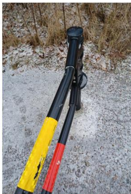
Bild från Tenstadalen mot Tenstavägen, en sönderkörd gräsmatta samt en bom som satts ur bruk efter ha blivit påkörd när någon försökt ta sig igenom till parkyta.