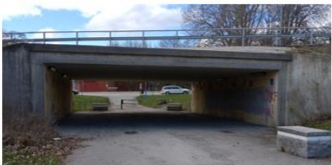
Svinningegångens tunnel, trots en solig dag upplevs båda tunnlarna mörka