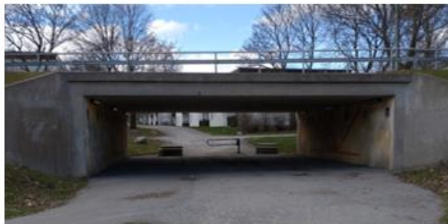
Tunneln närmast Spånga kyrka