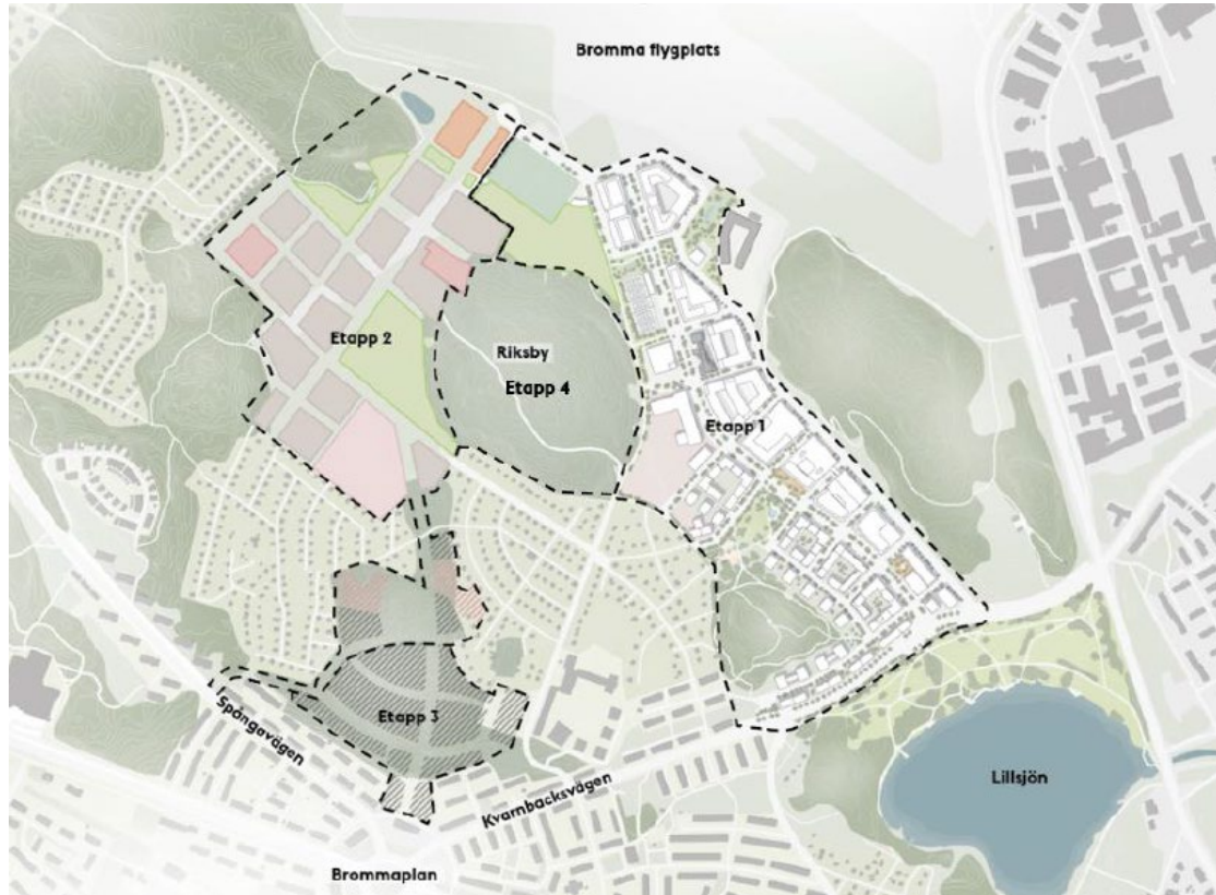
Figur 1, Översikt av etappindelning för Brommaprogrammet (Riksby). Detta ärende avser området benämnt Etapp 1.

Exploateringskontoret inväntar nu antagande av denna första detaljplan och söker därefter genomförandebeslut för att starta detaljprojektering under hösten 2024. Exploateringsnämndens investeringsutgift för aktuell detaljplan uppgår preliminärt till 2 772 mnkr.