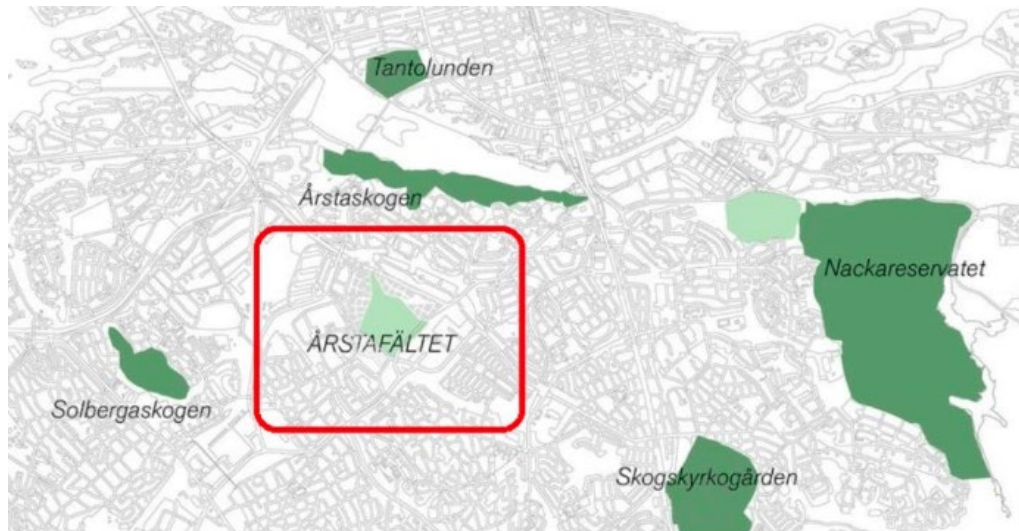
Figur 1. Projektets lokalisering i Stockholm, rödmarkerat.

Exploateringen på Årstafältet är planerad att utföras i 8 etapper, genom ett flertal detaljplaner. Stockholms stad har valt att samordna vissa av etapperna och genomföra en gemensam groventreprenad i vilken det bland annat ingår att förstärka marken för att möjliggöra byggnation av gator och ledningar.