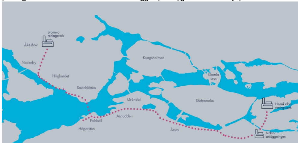
Den nya tunneln mellan Bromma och Sickla

Tunneln har en total sträckning på 14 km, se bild, och ligger på ett djup som går från -27 meter i anslutning till Bromma reningsverket till -46 m i anslutning till Sicklaanläggningen, undantaget i passagen under Mälaren där tunneln ligger på drygt 90 meters djup.