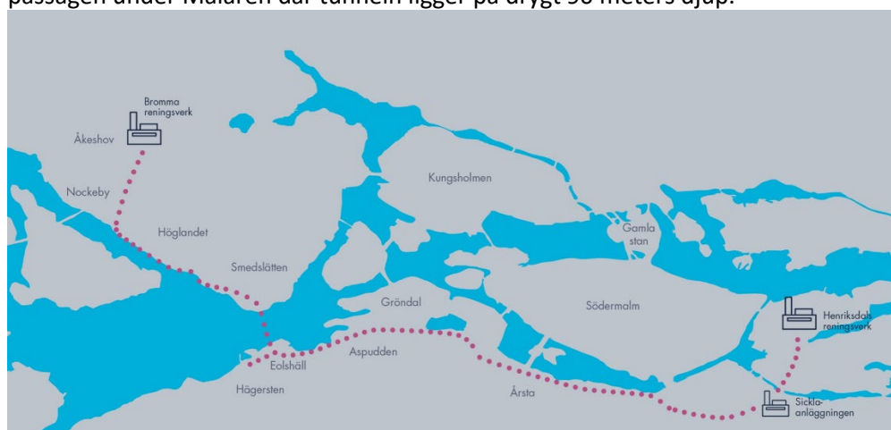
Den nya tunneln mellan Bromma och Sickla

Tunneln har en total sträckning på 14 km, se bild, och ligger på ett djup som går från -27 meter i anslutning till Bromma reningsverket till -46 m i anslutning till Sicklaanläggningen, undantaget i passagen under Mälaren där tunneln ligger på drygt 90 meters djup.