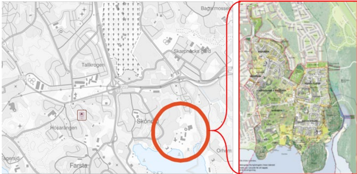
Figur 1. Översiktlig kartbild med strukturplan över Stora Sköndal.

Detta ärende avser den andra etappen, Etapp 2A, och syftar till att möjliggöra utbyggnad av cirka 1750 bostäder, en grundskola, förskolor, flera nya parker, samt gång- och cykelstråk, se Figur 2.