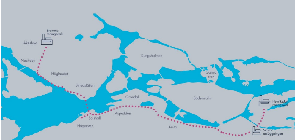
Den nya tunneln mellan Bromma och Sickla

Tunneln har en total sträckning på 14 km, se bild, och ligger på ett djup som går från -27 meter i anslutning till Bromma reningsverket till -46 m i anslutning till Sicklaanläggningen, undantaget i passagen under Mälaren där tunneln ligger på drygt 90 meters djup.