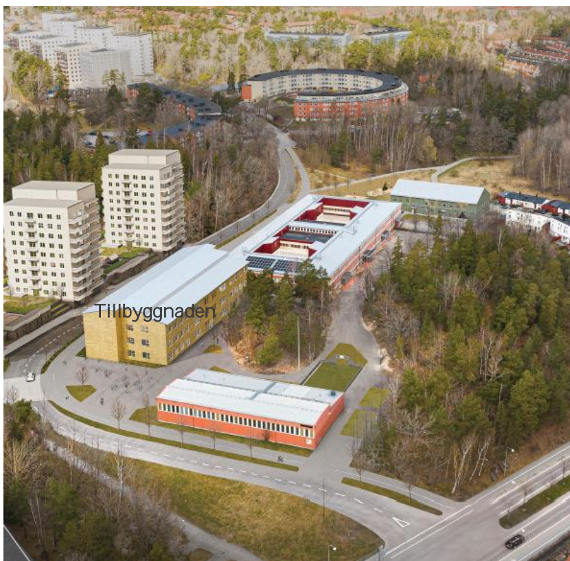
Skiss av Kvickentorpsskolan inklusive tillbyggnaden. Bildkälla: HMXW Arkitekter

Även idrottsbyggnaden om ca 900 kvm BRA byggs om för att göra plats för åtta omklädningsrum. Befintliga salar renoveras under 2020. Idrottsbyggnad renoveras också delvis avseende installationer. Teknikrummet flyttas till taket med anledning av att större yta behövs för aggregat. Idrottsbyggnaden ska göras möjlig att hyra ut.