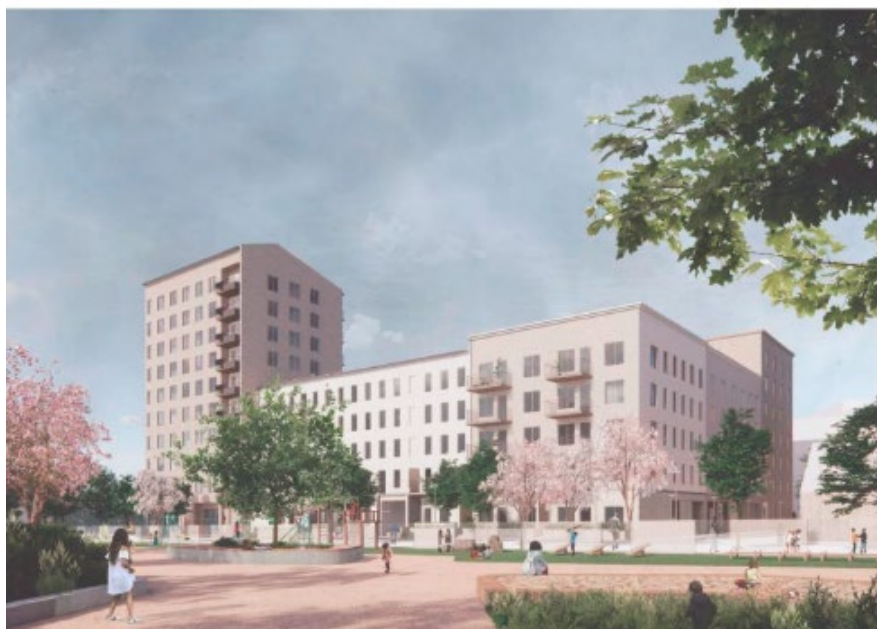
Fasadperspektiv mot öster